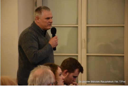
Ze zborów Biblioteki Raczyńskich / fot. T.Proc