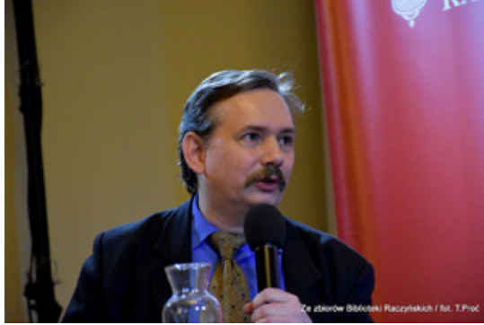
Ze zborów Biblioteki Raczyńskich