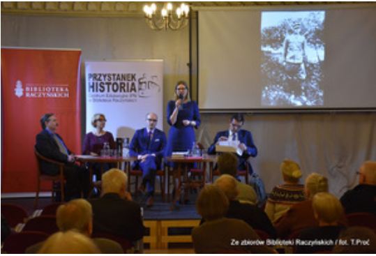
Ze zborów Biblioteki Raczyńskich