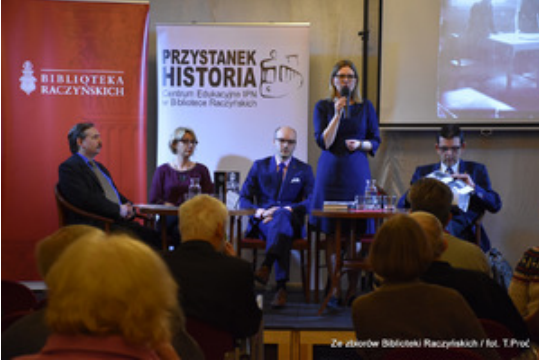
Ze zbiorów Biblioteki Raczyńskich / fot. T.Prod.