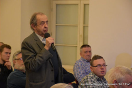
Ze zborów Biblioteki Raczyńskich