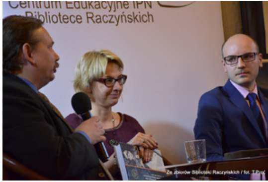
Ze zborów Biblioteki Raczyńskich / fot. T.Proc