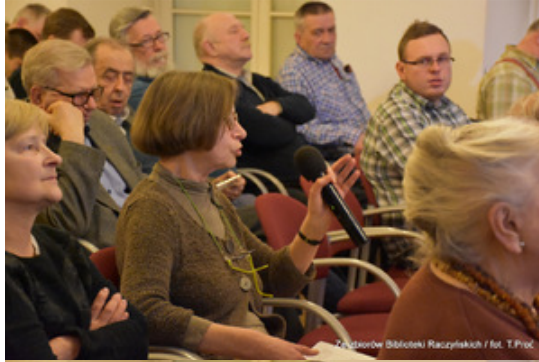
Ze zborów Biblioteki Raczyńskich / fot. T.Proc