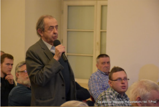
Ze zborów Biblioteki Raczyńskich / fot. T.Proc