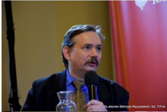
Ze zborów Biblioteki Raczyńskich / fot. T.Proc