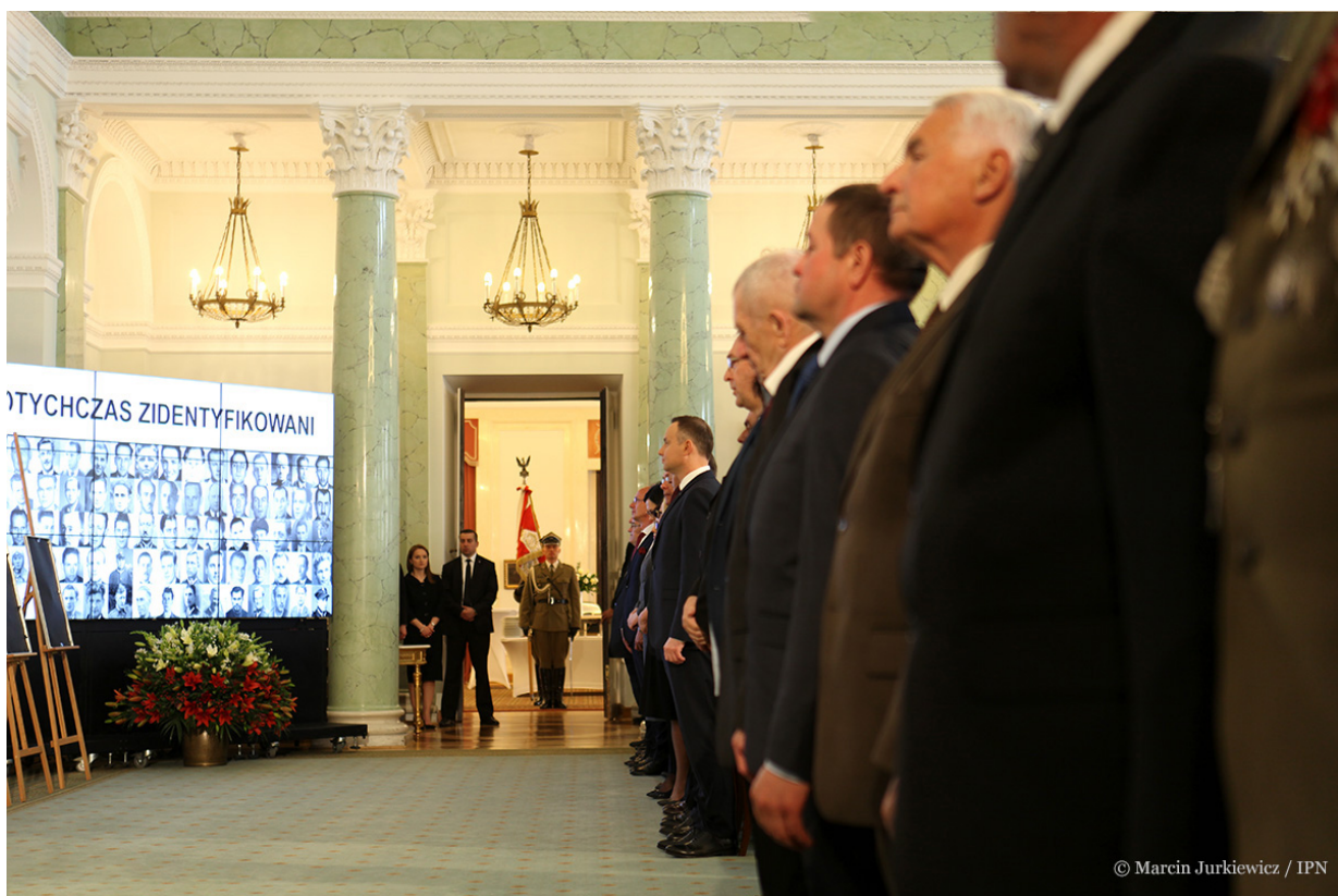
Wręczenie not identyfikacyjnych rodzinom ofiar totalitaryzmów w 2017 roku

W czwartek, o godz. 11.00, w Pałacu Prezydenckim odbędzie się uroczystość wręczenia not identyfikacyjnych członkom rodzin dwudziestu dwóch ofiar totalitaryzmów. Podczas uroczystości planowane jest wystąpienie Prezydenta RP Andrzeja Dudy.