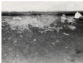
Komenda MO przy ul. Kasprowicza