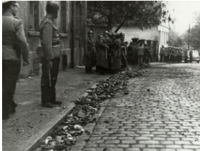
Wydarzenia Zielonogorskie 1960 roku