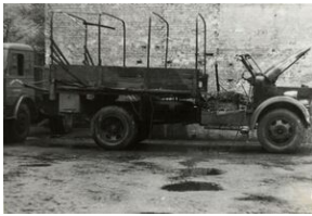
Komenda MO - zniszczone samochody