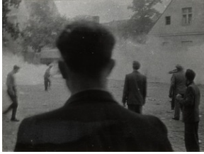
Wydarzenia Zielonogorskie 1960 roku