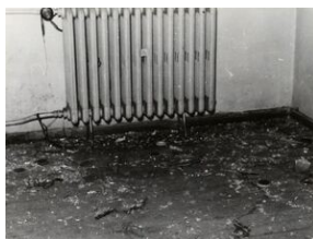
Komenda MO przy ul. Kasprowicza