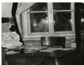
Komenda MO przy ul. Kasprowicza