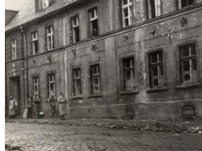
Komenda MO przy ulicy Kasprowicza po zajściach