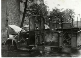
Komenda MO - zniszczone samochody