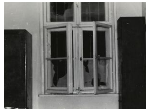
Komenda MO przy ul. Kasprowicza