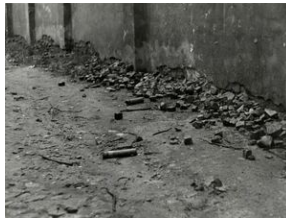
Komenda MO - kamienie i gruz