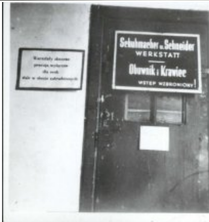
Warsztat rzemieślniczy w obozie