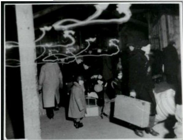
Przygotowanie do rewizji przybyłych więźniów