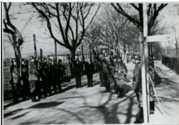
Obchody święta 1 Maja przez załogę niemieckiego obozu przy ul. Głównej