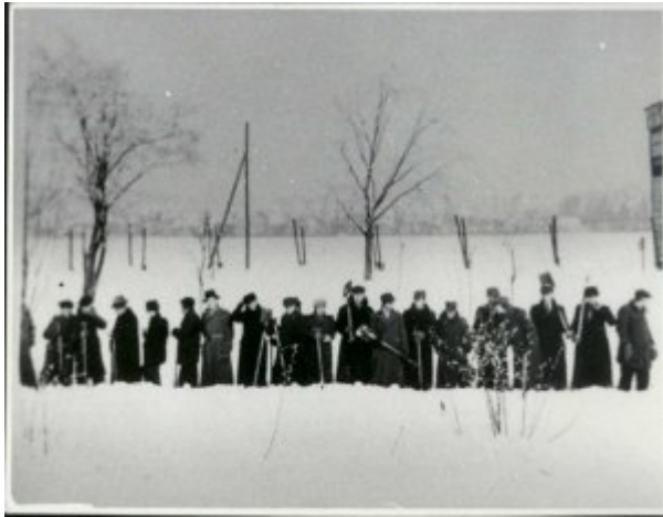
Prace obozowe przy odgarnianiu śniegu