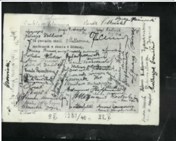
Podpisy więźniów, w prawym górnym rogu - Cyryl Ratajski, 9 maja 1940 r.