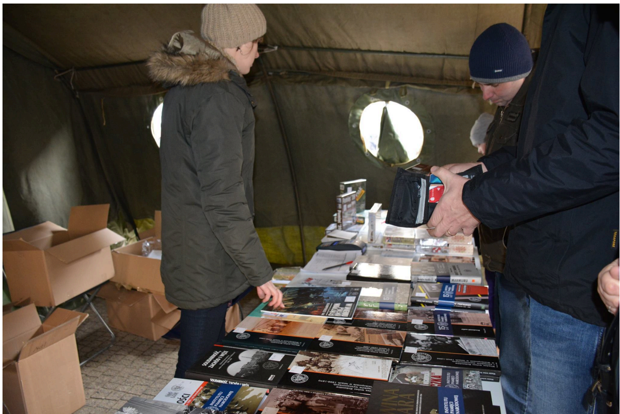
Namioty Wykłych 2016