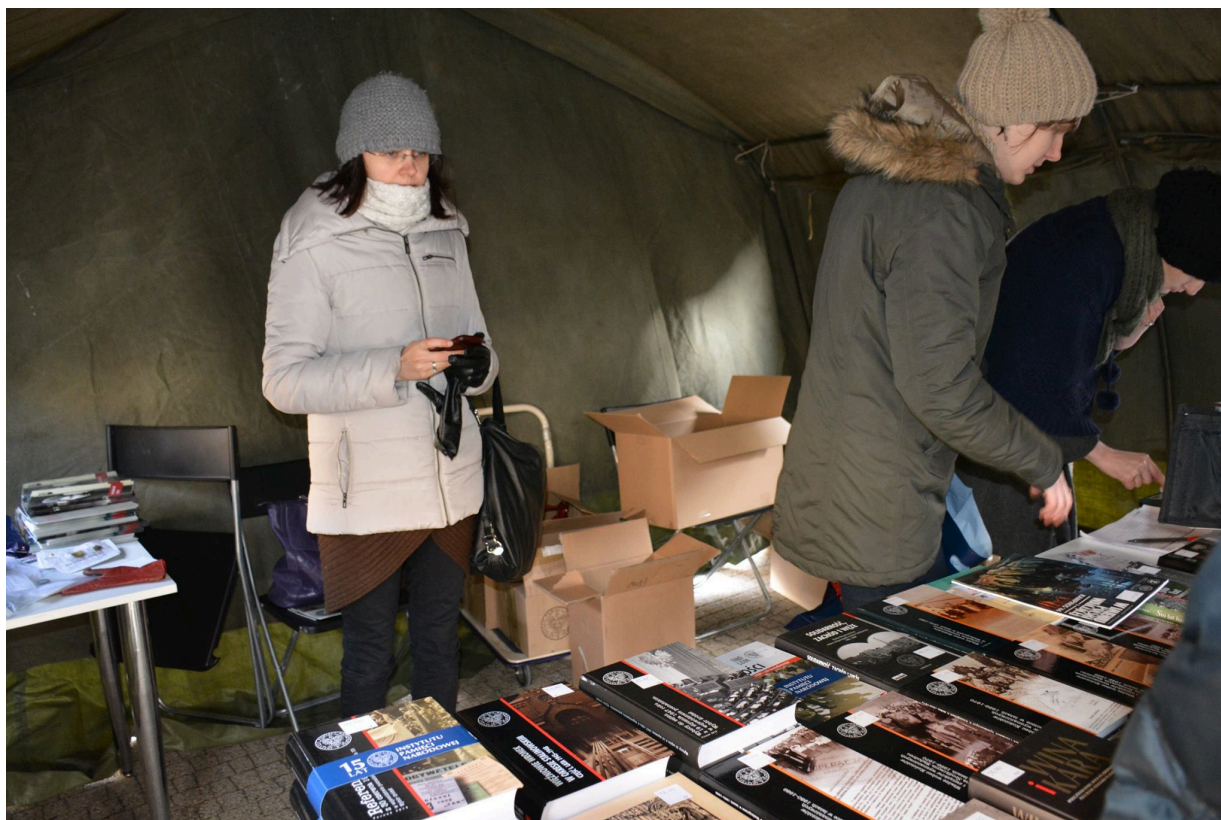
Namioty Wykletych 2016