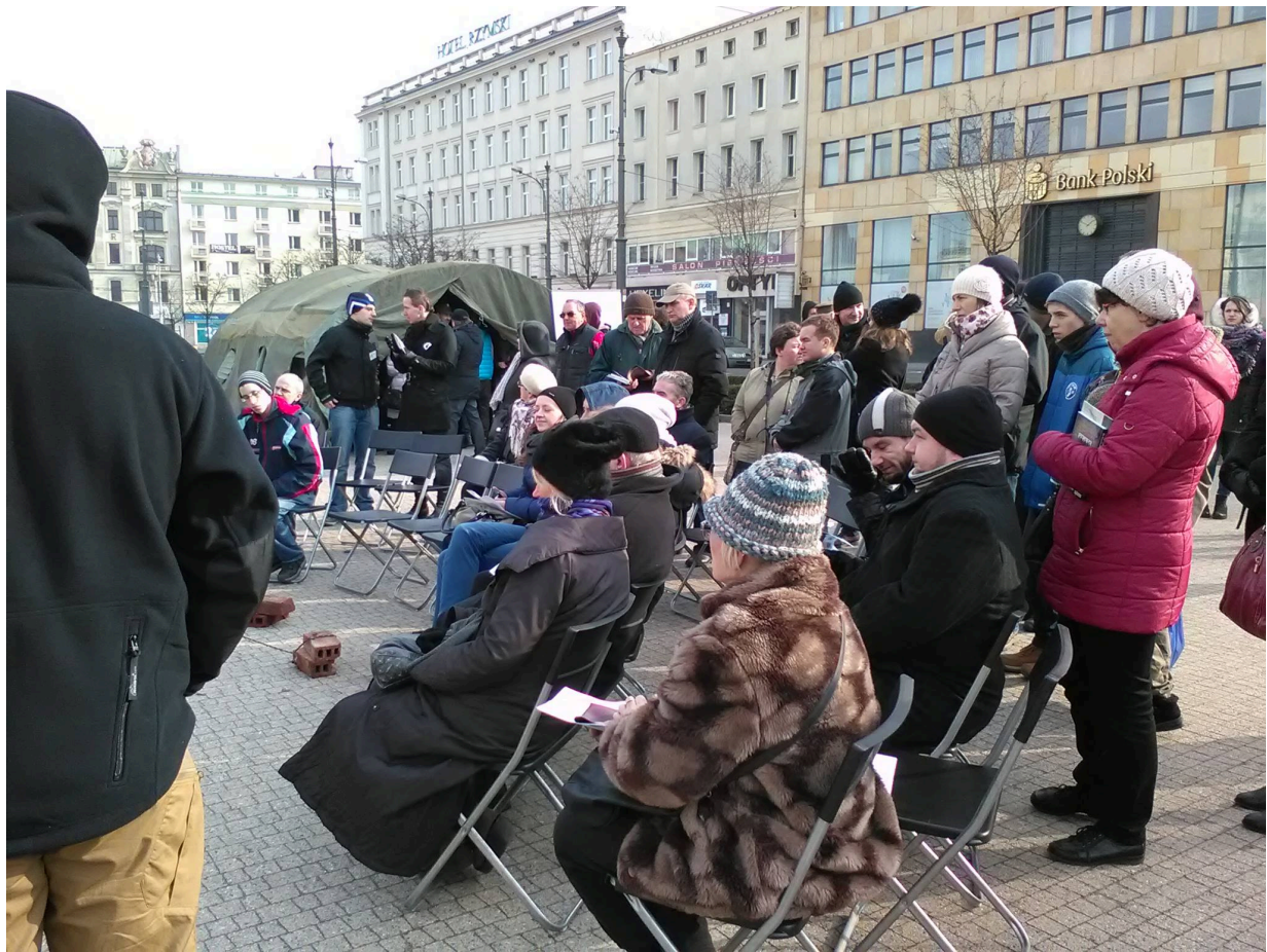
Namioty Wykletych 2016