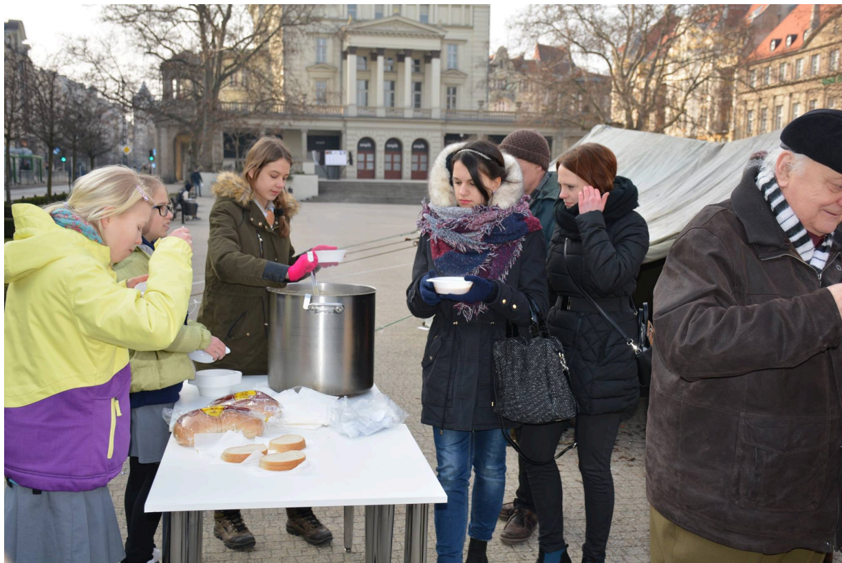
Namioty Wykletych 2016