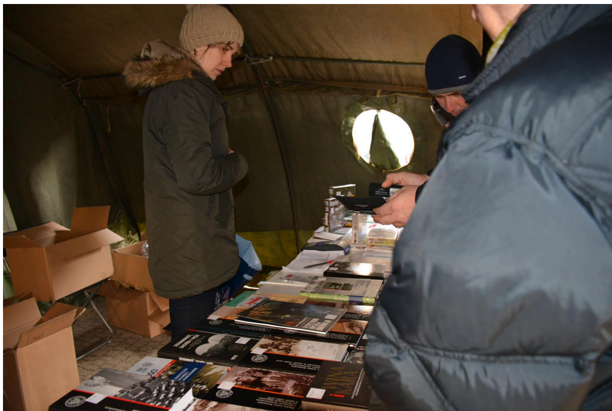
Namioty Wykletych 2016