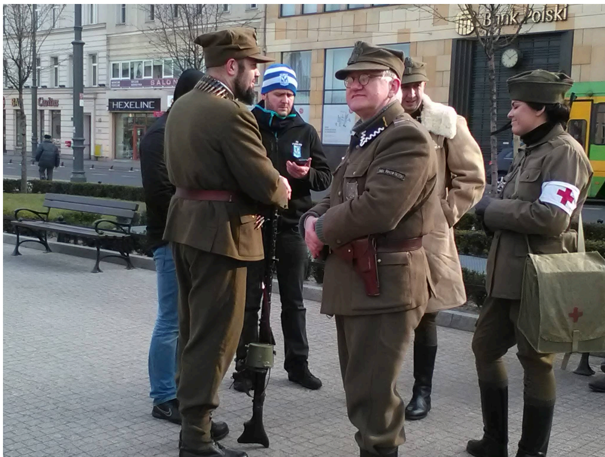
Namioty Wykletych 2016