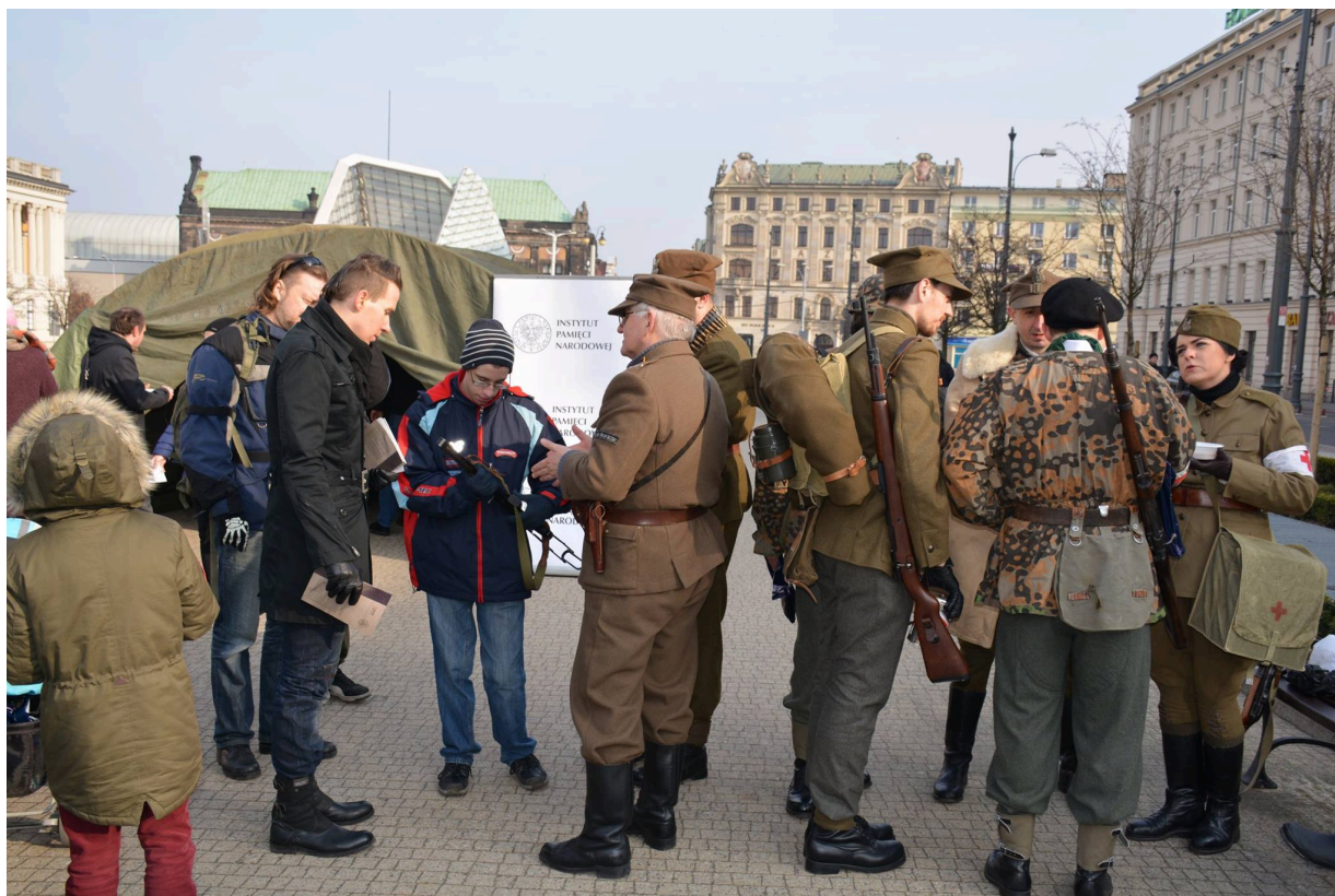
Namioty Wykletych 2016