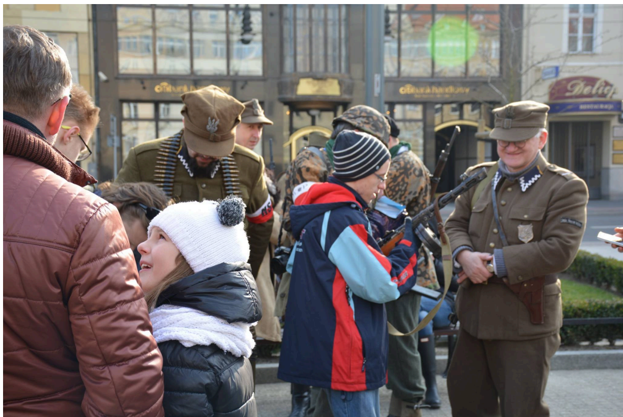
Namioty Wykletych 2016