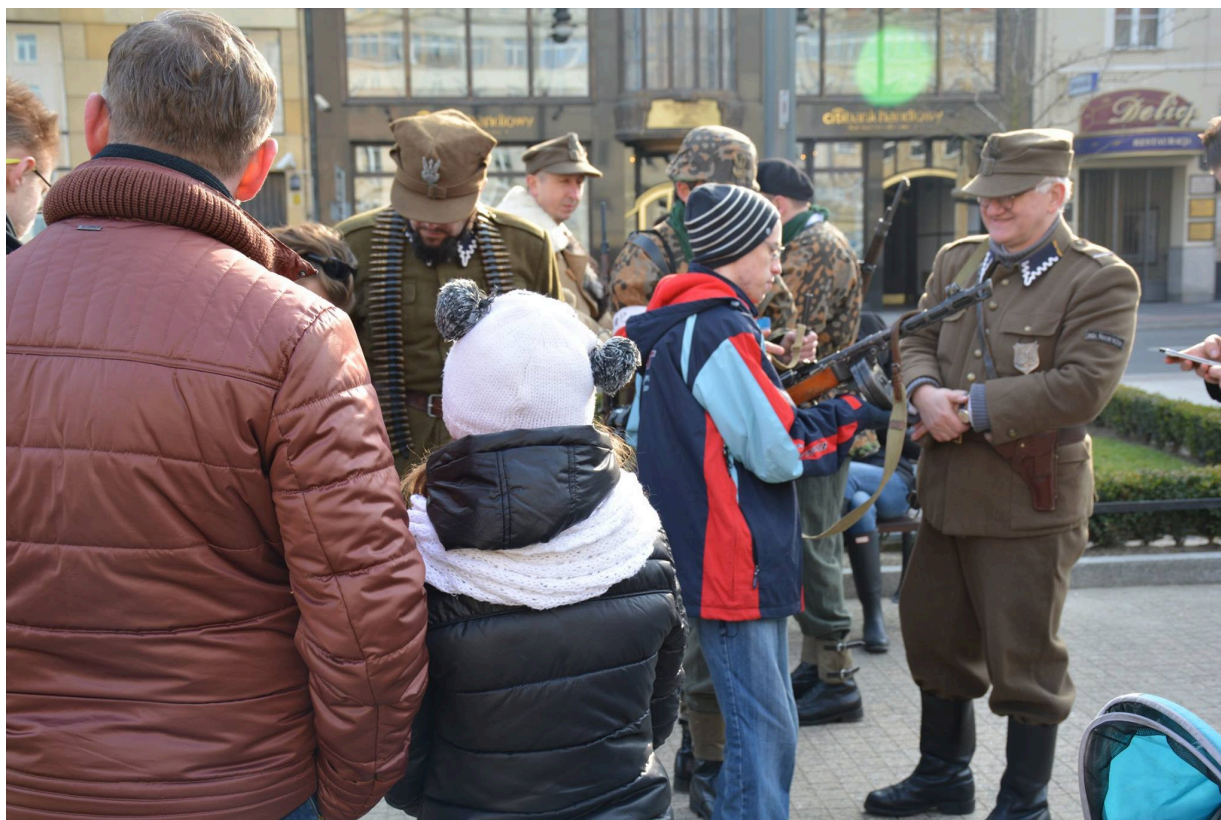
Namioty Wykletych 2016