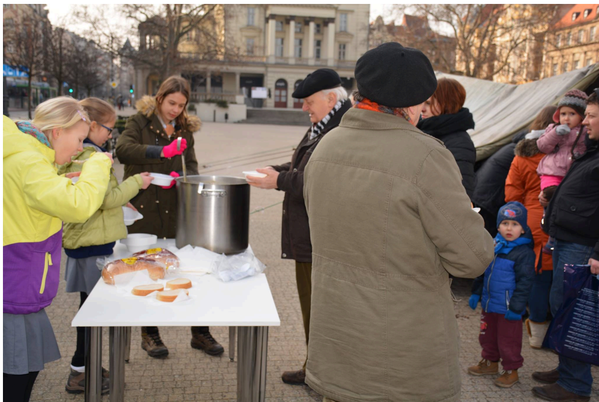
Namioty Wykletych 2016