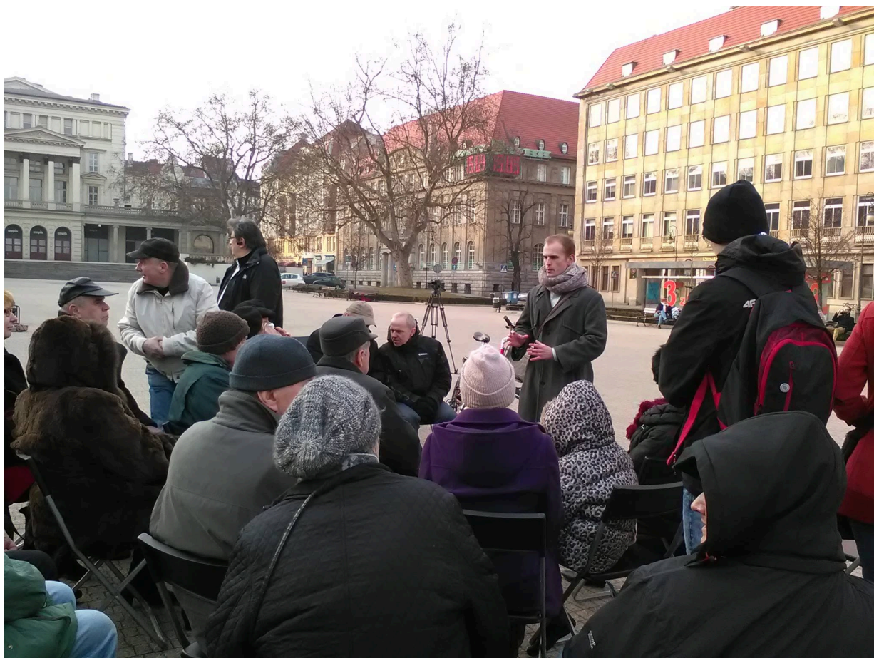
Namioty Wykletych 2016