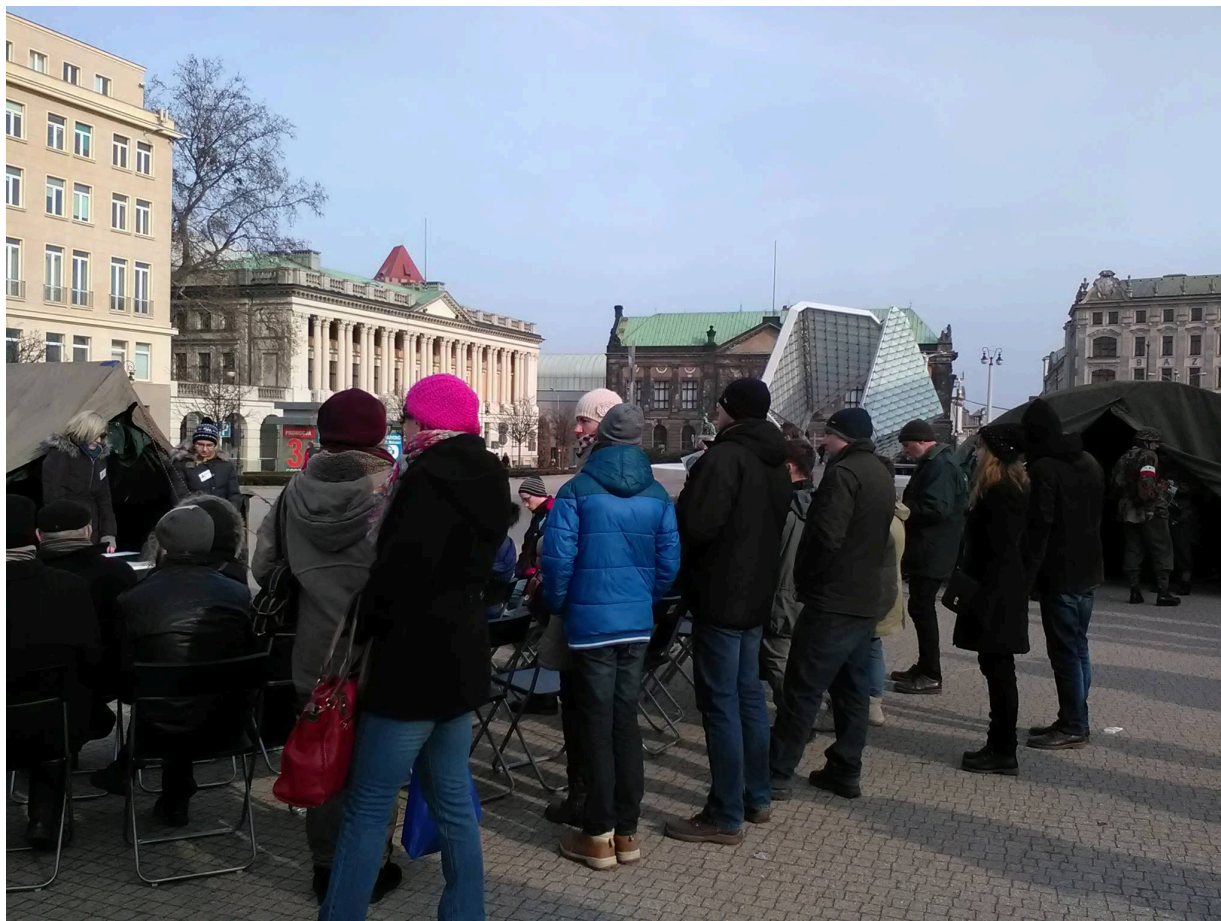
Namioty Wyklętych 2016