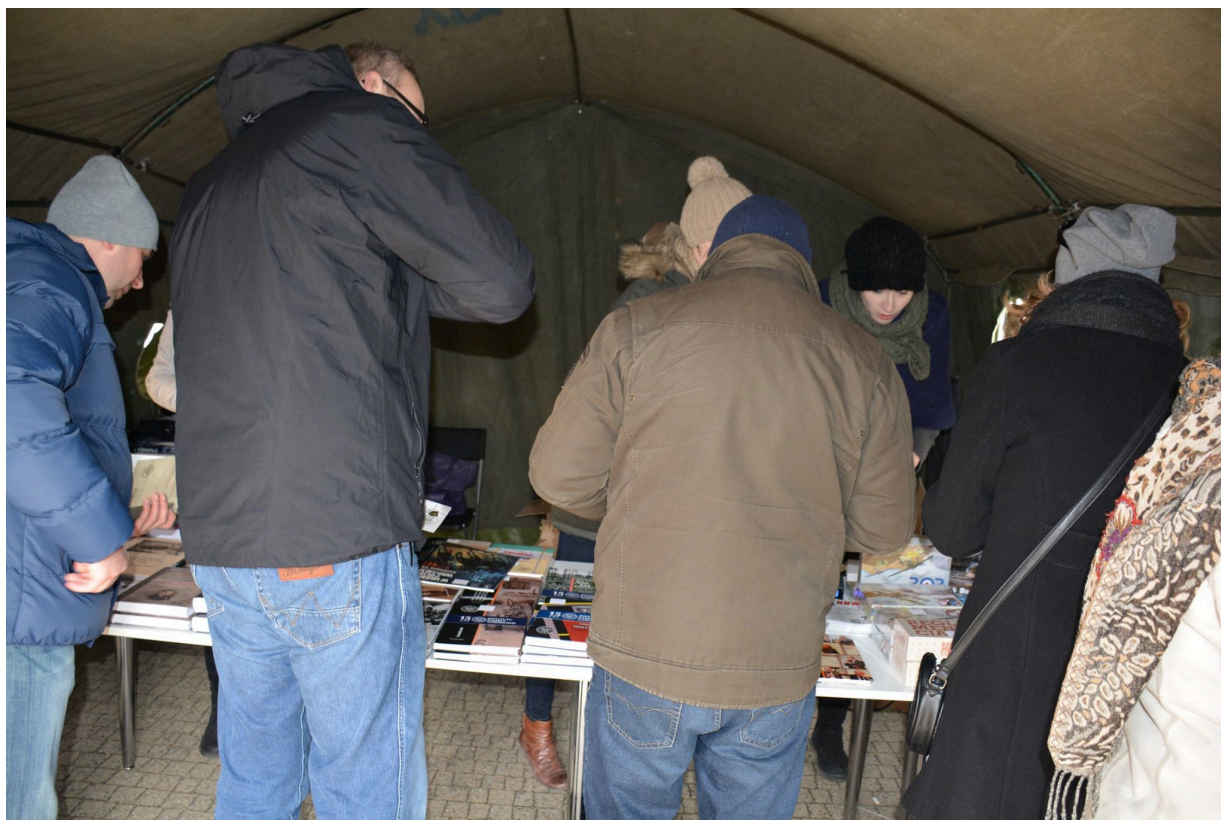
Namioty Wykletych 2016