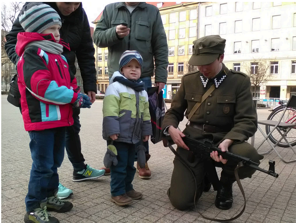
Namioty Wykletych 2016