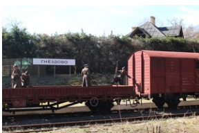
IV Katyński Marsz Cieni