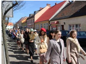
IV Katyński Marsz Cieni