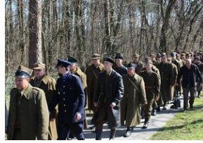
IV Katyński Marsz Cieni