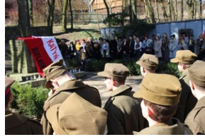
IV Katyński Marsz Cieni