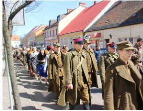
IV Katyński Marsz Cieni