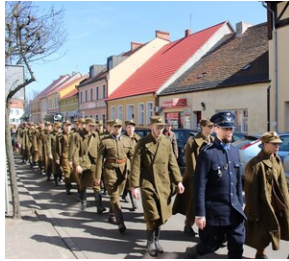
IV Katyński Marsz Cieni