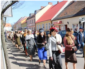
IV Katyński Marsz Cieni