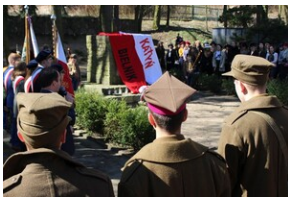
IV Katyński Marsz Cieni