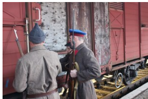
IV Katyński Marsz Cieni