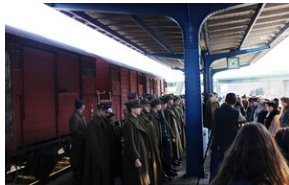
IV Katyński Marsz Cieni