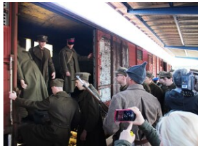
IV Katyński Marsz Cieni