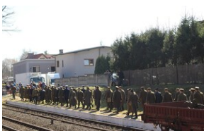
IV Katyński Marsz Cieni