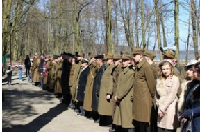
IV Katyński Marsz Cieni