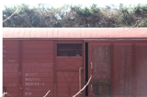
IV Katyński Marsz Cieni