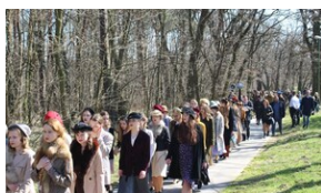
IV Katyński Marsz Cieni