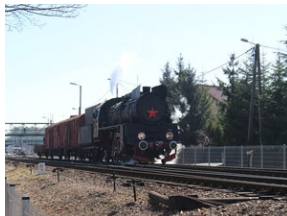
IV Katyński Marsz Cieni