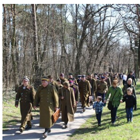
IV Katyński Marsz Cieni