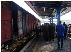
IV Katyński Marsz Cieni