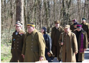
IV Katyński Marsz Cieni