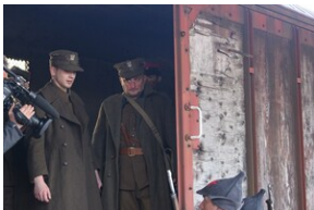
IV Katyński Marsz Cieni