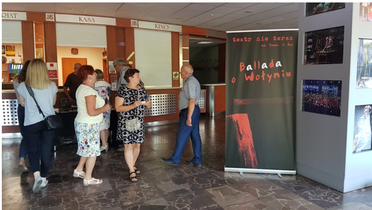
Spektakl „Ballada o Wołyniu” Teatru Nie Teraz.