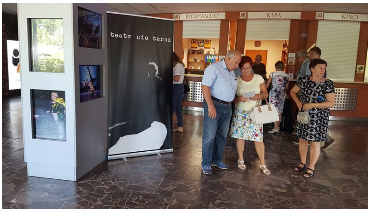
Spektakl „Ballada o Wołyniu” Teatru Nie Teraz.