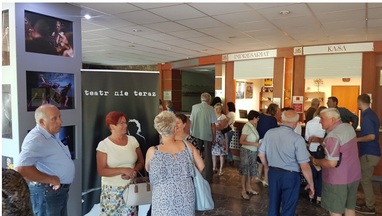
Spektakl „Ballada o Wołyniu” Teatru Nie Teraz.