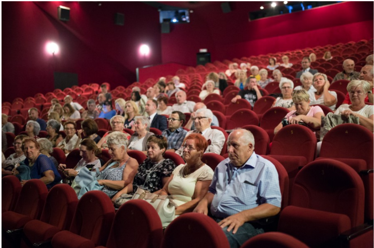
Spektakl „Ballada o Wołyniu” Teatru Nie Teraz.

Spektakl w ramach obchodów 75. rocznicy Zbrodni Wołyńskiej