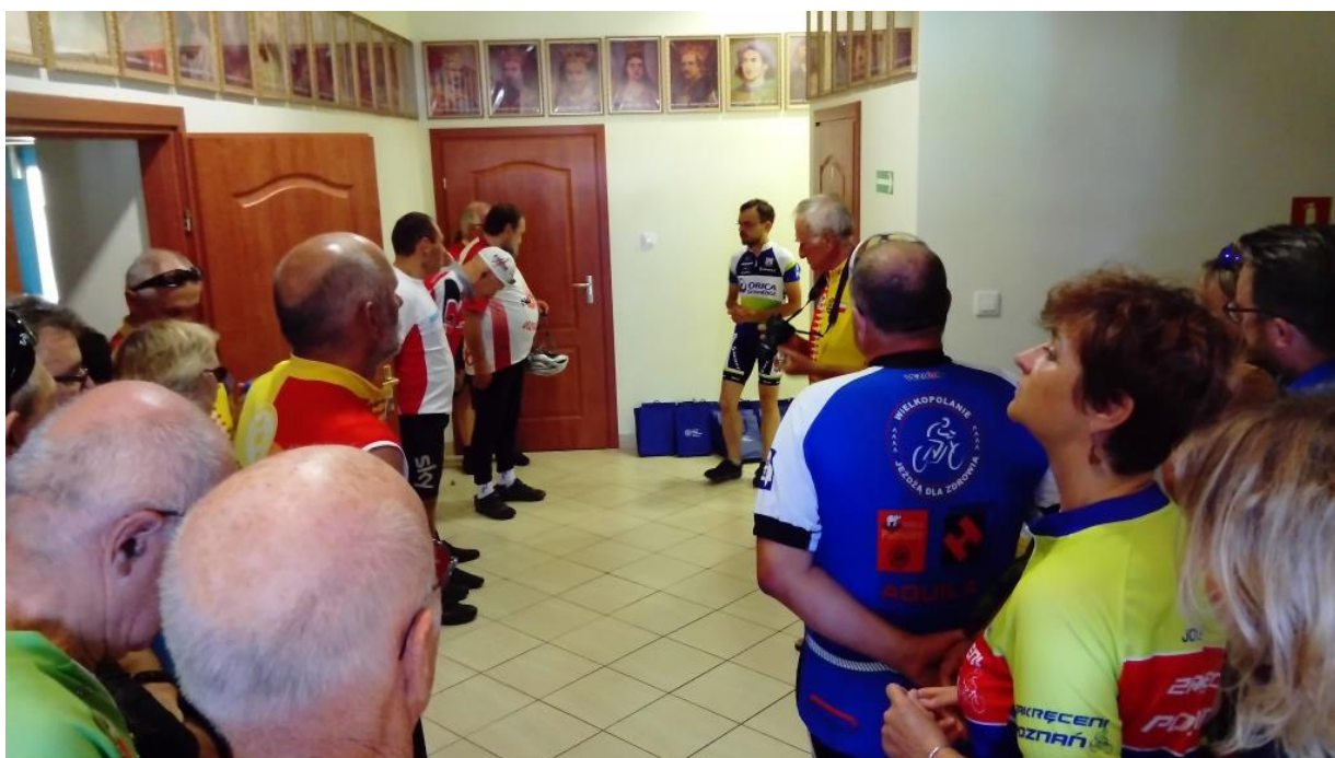
Rowerowy Rajd Gwiazdzisty „Ścieżkami historii. Śladami Powstania Wielkopolskiego”

18 sierpnia odbył się Rowerowy Rajd Gwiazdzisty „Ścieżkami historii. Śladami Powstania Wielkopolskiego” przygotowany przez Oddziałowe Biuro Edukacji Narodowej IPN w Poznaniu.