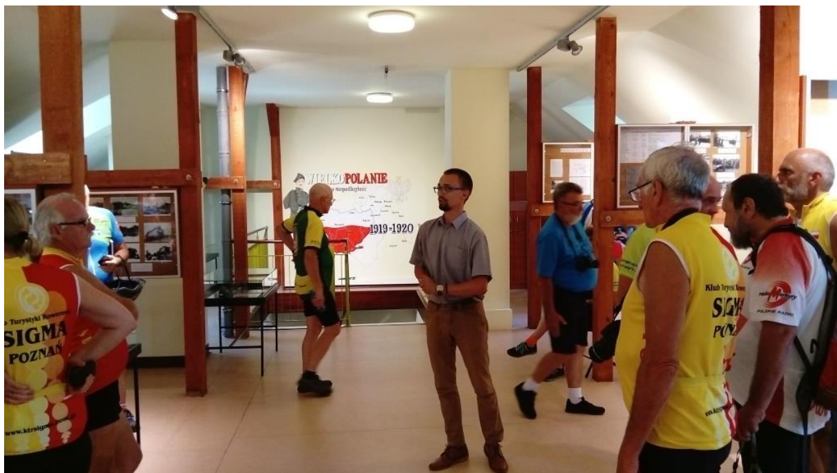
Rowerowy Rajd Gwiazdzisty „Ścieżkami historii. Śladami Powstania Wielkopolskiego”