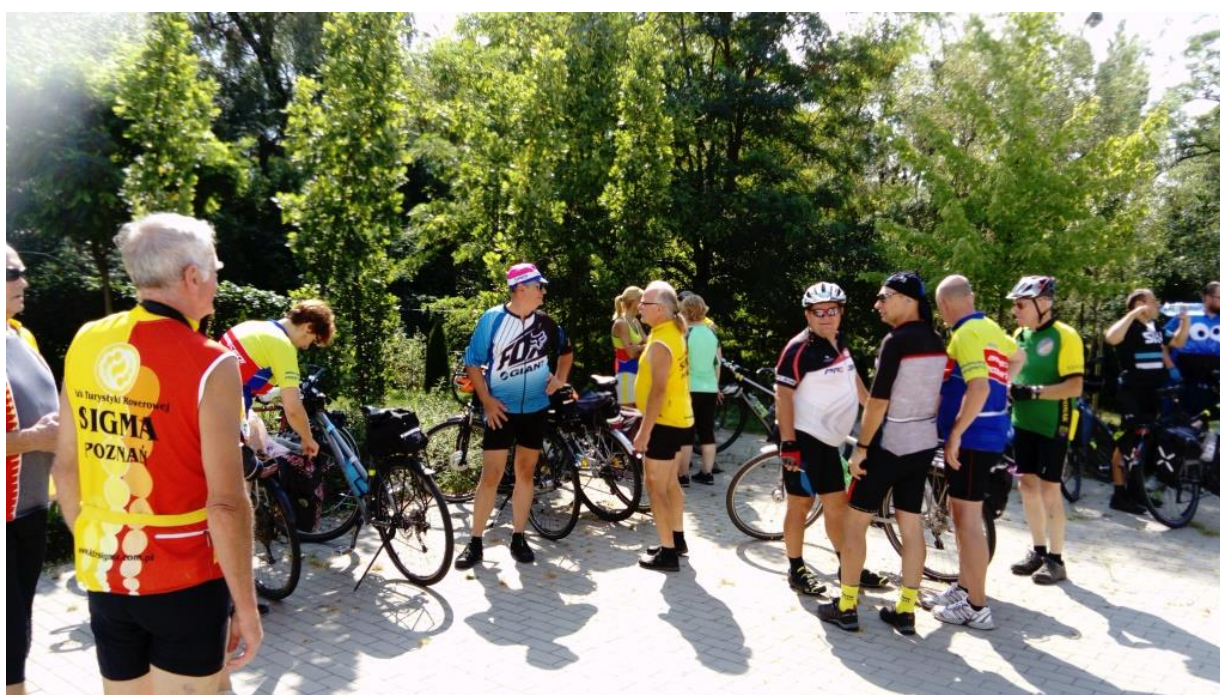
Rowerowy Rajd Gwiazdzisty „Ścieżkami historii. Śladami Powstania Wielkopolskiego”