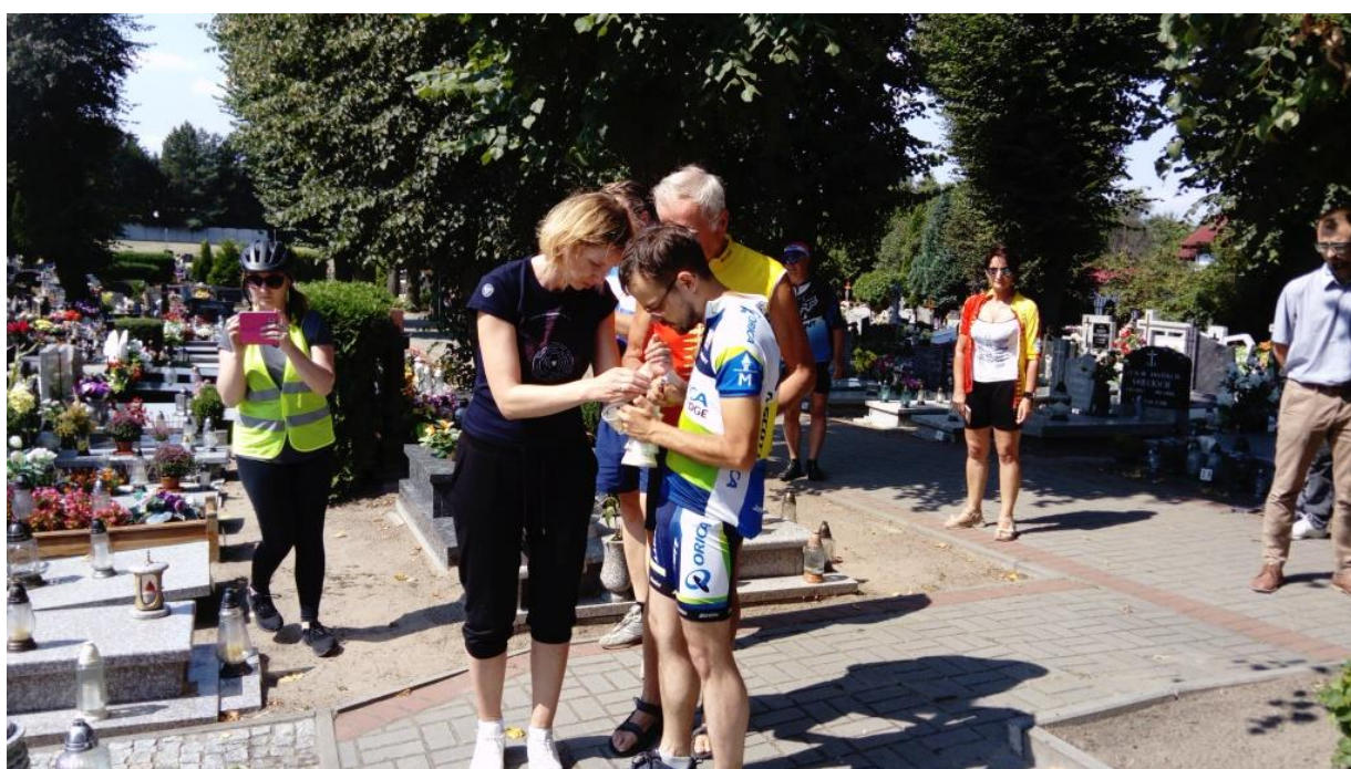
Rowerowy Rajd Gwiazdzisty „Ścieżkami historii. Śladami Powstania Wielkopolskiego”