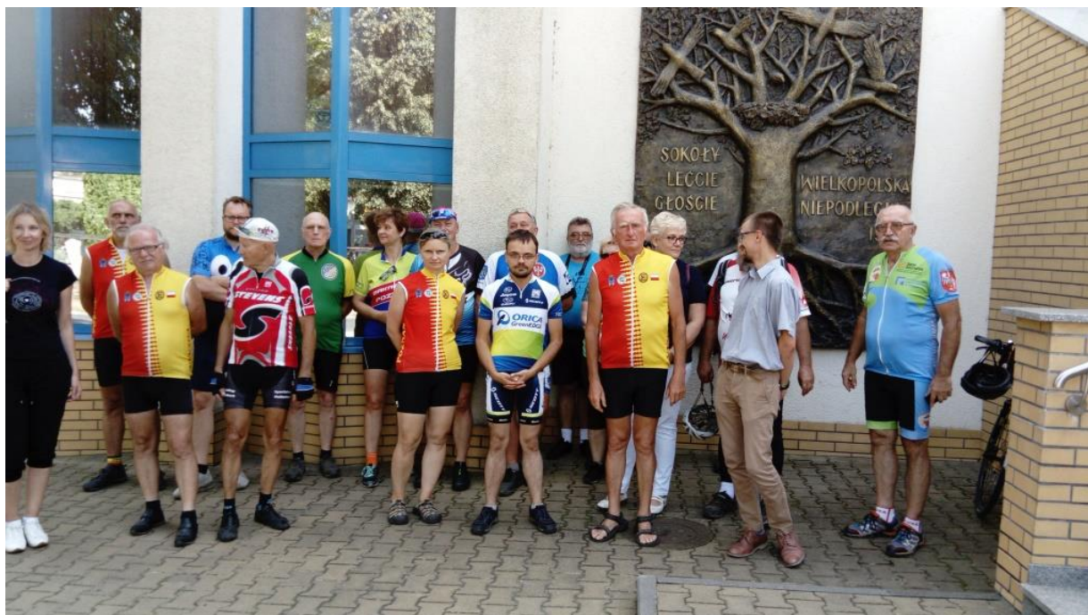
Rowerowy Rajd Gwiazdzisty „Ścieżkami historii. Śladami Powstania Wielkopolskiego”