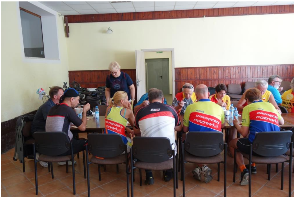
Rowerowy Rajd Gwiazdzisty „Ścieżkami historii. Śladami Powstania Wielkopolskiego”