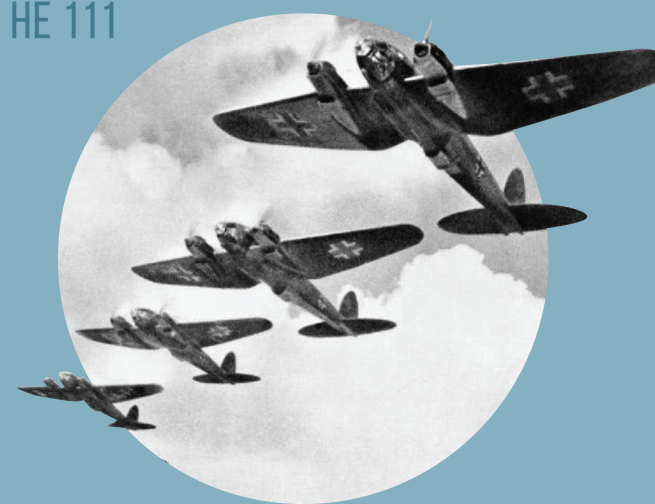
HEINKEL HE 111

Od 10 lipca do 31 października 1940 roku toczyła się Bitwa o Anglię. Zadaniem Luftwaffe było zdobycie przewagi w powietrzu, co miało umożliwić Niemcom inwazję na Wyspy Brytyjskie i zwycięstwo w wojnie. Walki toczyły się w kilku fazach, z których przełomowa była trzecia. Od 7 września Niemcy bombardowali zmasowanymi formacjami (liczącymi nawet ponad tysiąc maszyn) Londyn, powodując duże straty. 15 września nastąpił przełom – 31 alianckich dywizjonów myśliwskich (m.in. polskie 302 i 303) odparło skutecznie nalot niszcząc rekordową liczbę 61 niemieckich samolotów. Mimo początkowej przewagi, to Luftwaffe ponosiła większe straty w ludziach i w sprzęcie, których niemiecka maszyna wojenna nie była w stanie uzupełniać tak szybko, jak brytyjska.