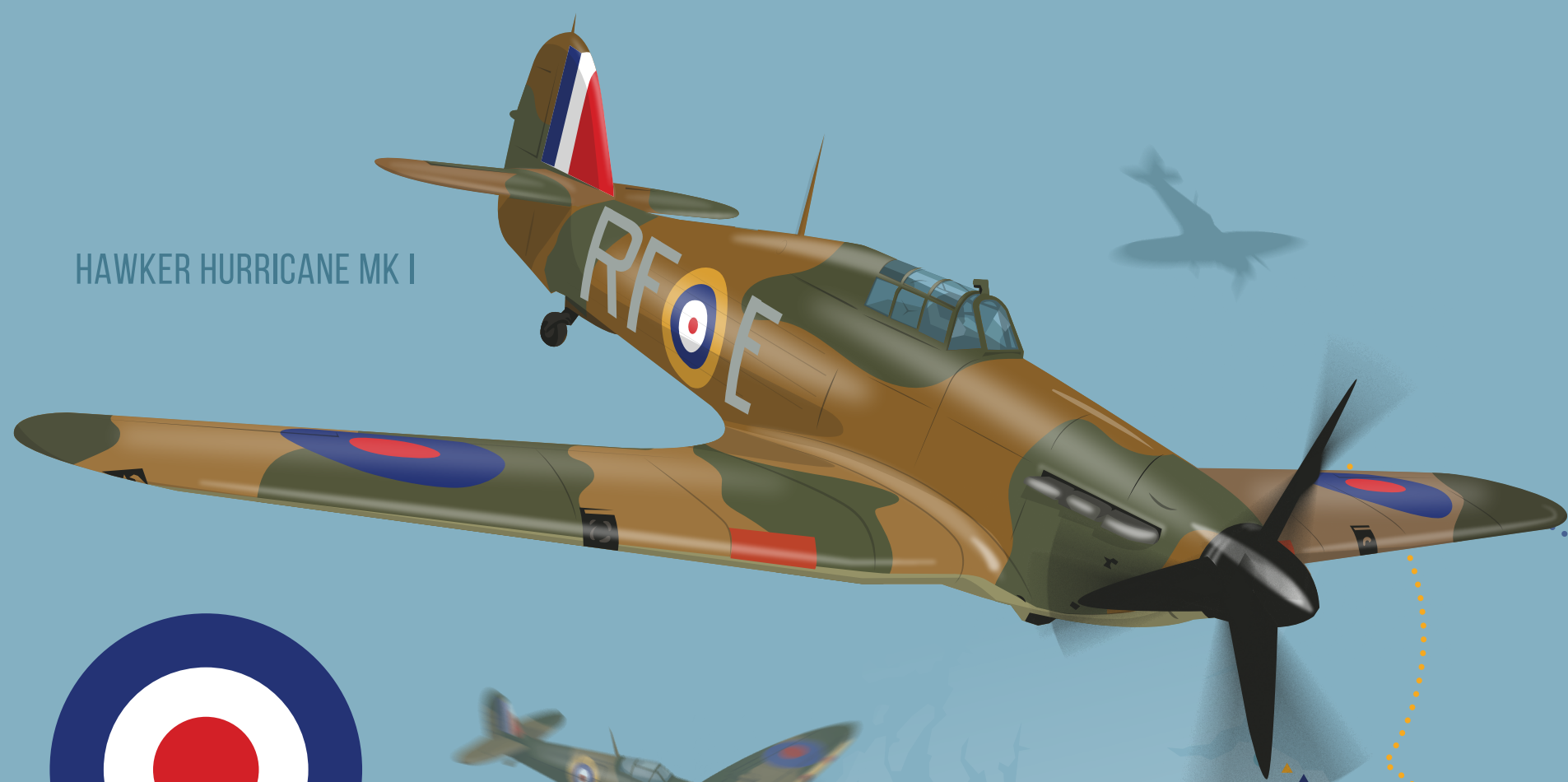
HAWKER HURRICANE MK I