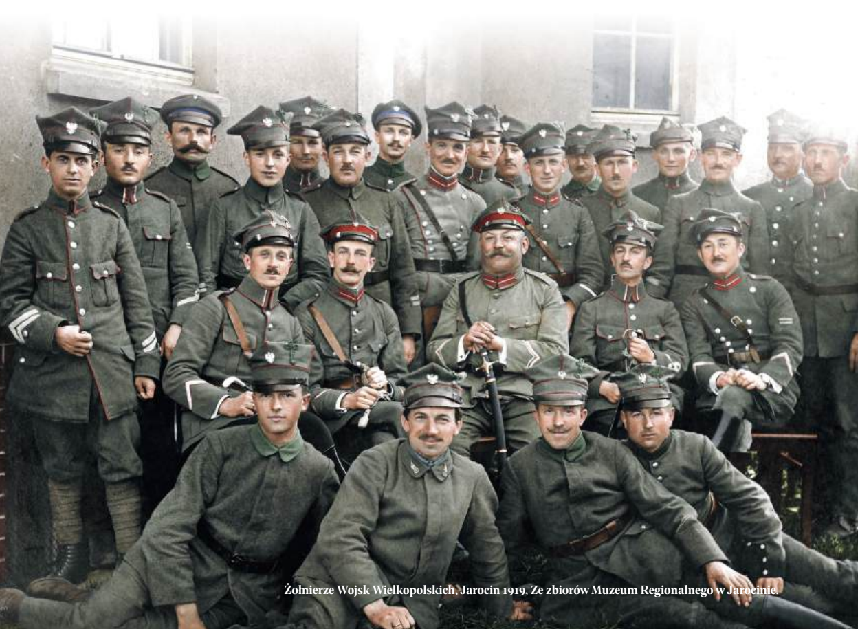
Żołnierze Wojsk Wielkopolskich, Jarocin 1919.

Uczniowie szkół podstawowych (klasy VII–VIII) oraz szkół ponadpodstawowych, studenci, pozostałe osoby dorosłe