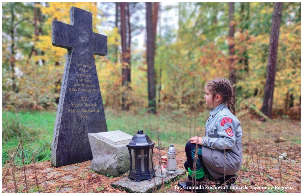
fol. Gromada Zuchowa Tropiciiele Tajemnic z Rogoźna