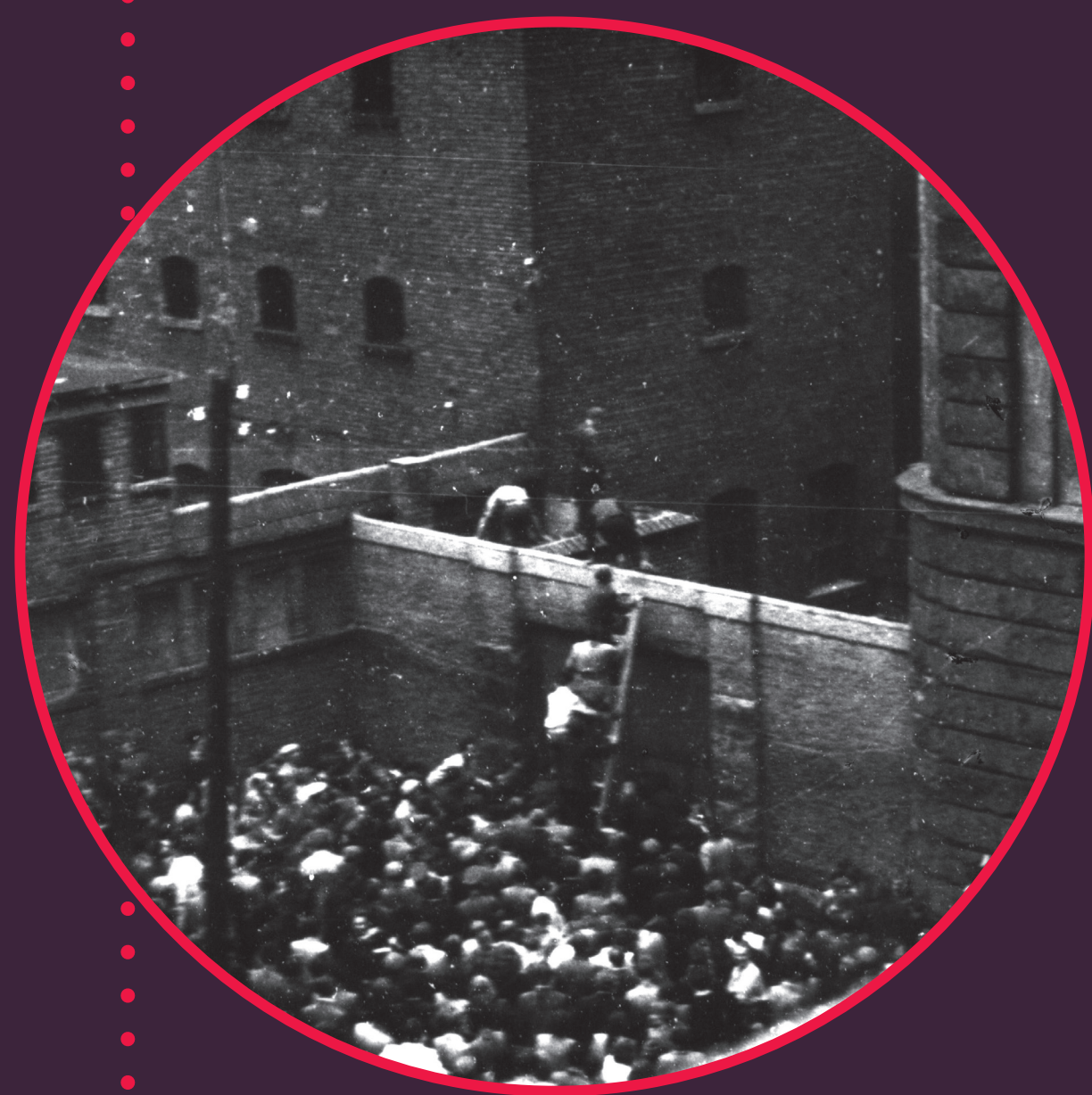
Szturm na więzienie przy ul. Młyńskiej

Idąc przed siedzibę UB część manifestantów wdarła się do budynku ZUS, w którym znajdowały się urządzenia zagłuszające zagraniczne audycje radiowe