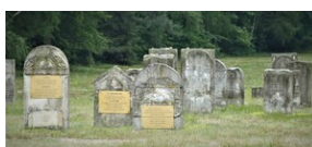
Las Rzuchowski: lapidarium macew z dawnego cmentarza żydowskiego w Turku