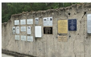
Las Rzuchowski: ściana pamięci ofiar obozu Kulmhof