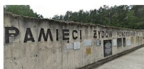
Las Rzuchowski: ściana pamięci ofiar obozu Kulmhof