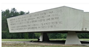
Las Rzuchowski: pomnik z 1964 r.