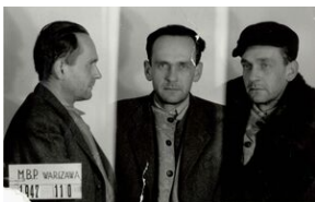
Płk NSZ Stanisław Kasznica, oficer WP, uczestnik kampanii 1939 r., komendant Okręgu II Poznań, ostatni dowódca NSZ, stracony 12 maja 1948 r. w więzieniu mokotowskim w Warszawie.