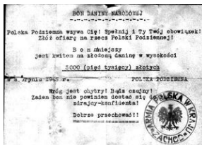
Bon Armii Polskiej (NSZ) 1945.