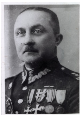
Płk NSZ Edmund Effert, powstaniec wielkopolski, oficer WP, drugi komendant Okręgu IX Poznań NSZ, zamordowany 7 czerwca 1944 w Zabikowie.

W lutym 1945 r. na terenie Poznania i powiatu poznańskiego część NSZ nie scalona w czasie wojny z AK utworzyła Okręg II Poznań (kryptonim „Armia Polska w kraju zachód”) pod dowództwem płk. Stanisława Kasznicy. Podlegało mu ok. stu osób zorganizowanych w Obwodach: miasto Poznań, Poznań-Północ i sekcji żeńskiej. Okręg Poznań prowadził działania propagandowe, wywiadowcze i ekspropriacyjne. W okresie od lipca do września 1945 r. na skutek aresztowań Okręg II Poznań NSZ został rozbity, a jego struktury nie zostały odtworzone. Ocalałymi strukturami na terenie Obwodu m. Poznań kierował kpt. Józef Wysoki, nie zdołał on jednak odbudować struktur organizacyjnych. Działalność konspiracyjną zawieszono w 1946 r.