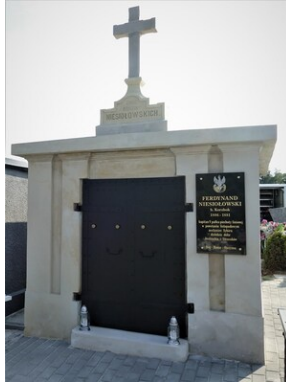
Grobowiec po remoncie