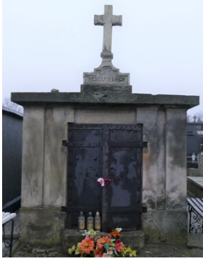
Grobowiec przed remontem