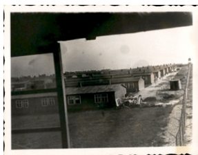
Archiwum Pełne Pamięci: Wyzwolenie obozu na Majdanku