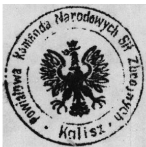
Pieczczę powiatu kaliskiego NSZ (1943)