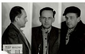
Płk NSZ Stanisław Kasznica, oficer WP, uczestnik kampanii 1939 r., komendant Okręgu II Poznań, ostatni dowódca NSZ, stracony 12 maja 1948 r. w więzieniu mokotowskim w Warszawie.