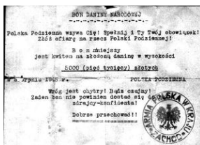
Bon Armii Polskiej (NSZ) 1945