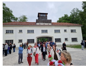
Obóz w Dachau