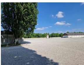
Obóz w Dachau