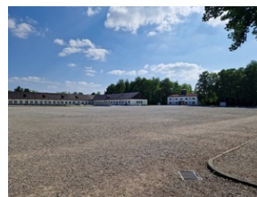
Obóz w Dachau