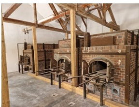
Obóz w Dachau