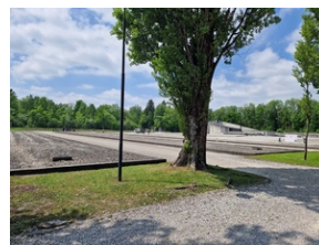
Obóz w Dachau