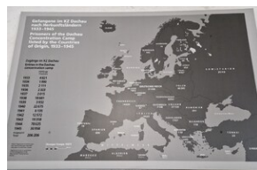
Obóz w Dachau