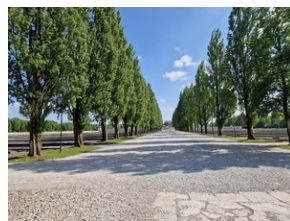
Obóz w Dachau