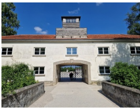
Obóz w Dachau

KL Dachau został wyzwolony przez żołnierzy amerykańskich 29 kwietnia 1945 r.