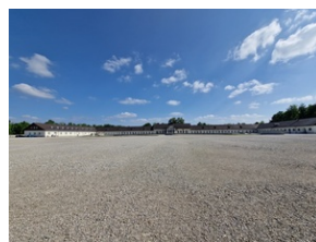
Obóz w Dachau