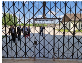
Obóz w Dachau