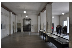
Miejsce Pamięci Dachau.