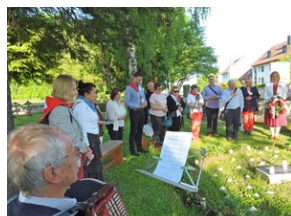
Cmentarz w miejscowości Indersdorf.