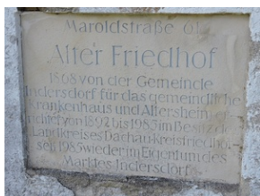
Cmentarz w miejscowości Indersdorf.