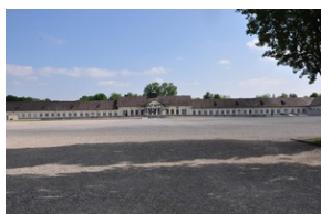
Miejsce Pamięci Dachau.

Wizyta w Miejscu Pamięci Dachau była dla polskiej strony bardzo ważna, przebiegała w bardzo życzliwej atmosferze i mamy nadzieję, że współpraca w zakresie upamiętniania historii polskich więźniów będzie owocnie kontynuowana.