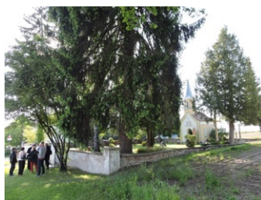
Cmentarz w miejscowości Indersdorf.