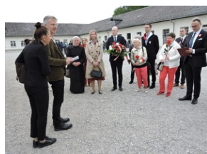
Miejsce Pamięci Dachau.