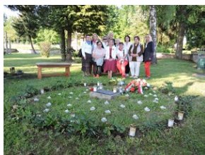
Cmentarz w miejscowości Indersdorf.