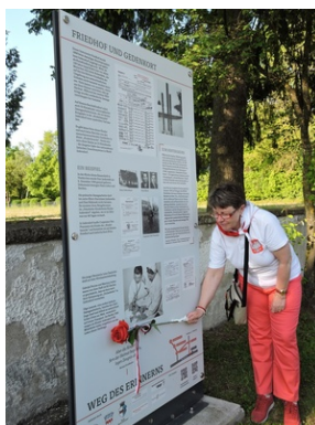
Cmentarz w miejscowości Indersdorf.