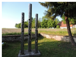
Cmentarz w miejscowości Indersdorf.