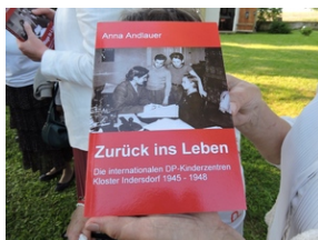
Cmentarz w miejscowości Indersdorf.