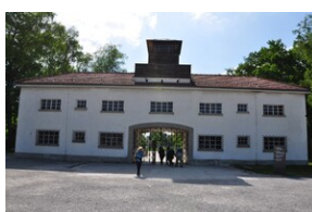
Miejsce Pamięci Dachau.