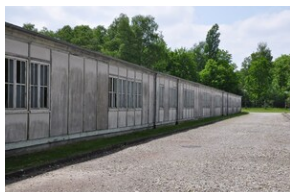
Miejsce Pamięci Dachau.