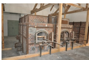
Miejsce Pamięci Dachau.