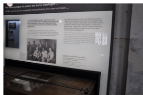
Miejsce Pamięci Dachau.