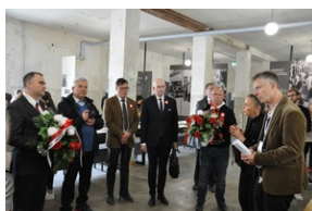
Miejsce Pamięci Dachau.