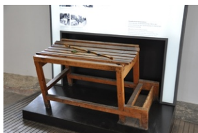
Miejsce Pamięci Dachau.