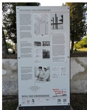
Cmentarz w miejscowości Indersdorf.