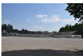
Miejsce Pamięci Dachau.