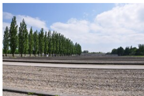
Miejsce Pamięci Dachau.