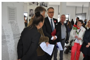
Miejsce Pamięci Dachau.