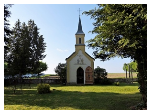
Cmentarz w miejscowości Indersdorf.