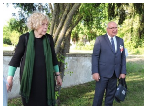
Cmentarz w miejscowości Indersdorf.