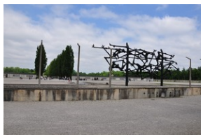
Miejsce Pamięci Dachau.