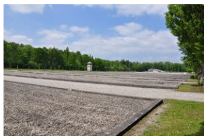
Miejsce Pamięci Dachau.