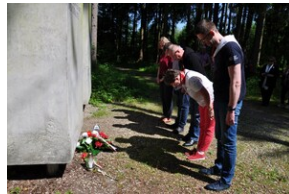
Miejsce Pamięci Mühldorfer Hart. Obóz leśny dla więźniów.