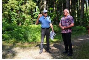
Miejsce Pamięci Mühldorfer Hart. Obóz leśny dla więźniów.