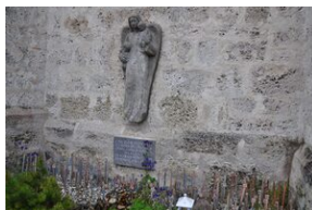
Cmentarz w miejscowości Burgkirchen an der Alz.