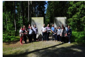
Miejsce Pamięci Mühldorfer Hart. Obóz leśny dla więźniów.