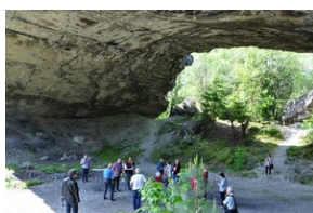
Bunkier zbrojeniowy kompleksu Mühldorfer Hart.