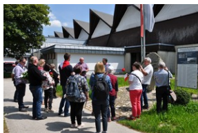
Pomnik w miejscowości Burgkirchen an der Alz.