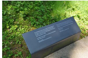
Miejsce Pamięci Mühldorfer Hart. Obóz leśny dla więźniów.