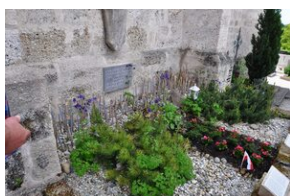
Cmentarz w miejscowości Burgkirchen an der Alz.