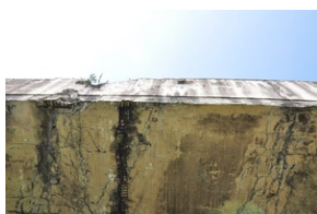
Bunkier zbrojeniowy kompleksu Mühldorfer Hart.

Po złożeniu wieńców i zniczy polska delegacja wyruszyła do miejscowości Burgkirchen an der Alz, gdzie znajduje się pomnik upamiętniający zamordowane przez Niemców dzieci robotnic przymusowych, głównie z terenu Europy Wschodniej, w tym z Polski.