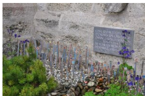
Cmentarz w miejscowości Burgkirchen an der Alz.