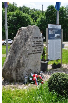
Pomnik w miejscowości Burgkirchen an der Alz.