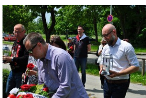
Pomnik w miejscowości Burgkirchen an der Alz.