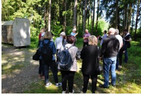
Miejsce Pamięci Mühldorfer Hart. Obóz leśny dla więźniów.