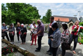
Cmentarz w miejscowości Burgkirchen an der Alz.