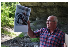
Bunkier zbrojeniowy kompleksu Mühldorfer Hart.