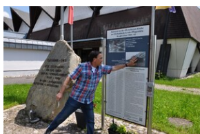
Pomnik w miejscowości Burgkirchen an der Alz.