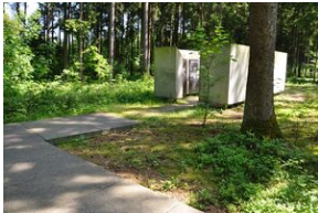
Miejsce Pamięci Mühldorfer Hart. Obóz leśny dla więźniów.