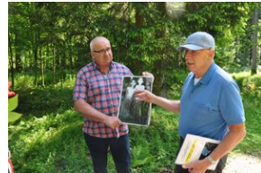
Miejsce Pamięci Mühldorfer Hart. Obóz leśny dla więźniów.