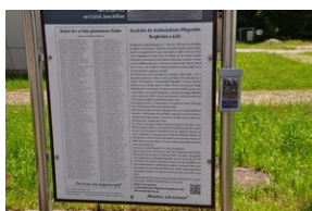
Pomnik w miejscowości Burgkirchen an der Alz.