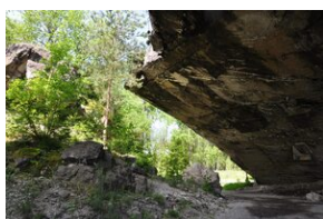
Bunkier zbrojeniowy kompleksu Mühldorfer Hart.