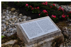
Cmentarz w miejscowości Burgkirchen an der Alz.