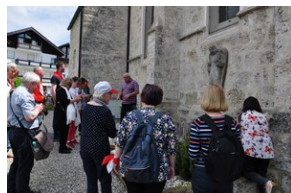
Cmentarz w miejscowości Burgkirchen an der Alz.