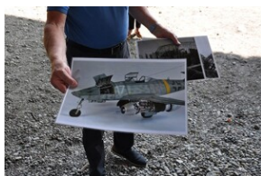
Bunkier zbrojeniowy kompleksu Mühldorfer Hart.