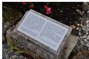
Cmentarz w miejscowości Burgkirchen an der Alz.