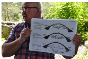
Bunkier zbrojeniowy kompleksu Mühldorfer Hart.