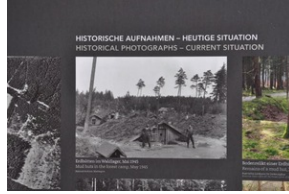
Miejsce Pamięci Mühldorfer Hart. Obóz leśny dla więźniów.