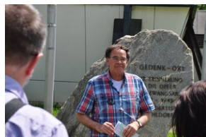
Pomnik w miejscowości Burgkirchen an der Alz.