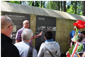
Miejsce Pamięci Mühldorfer Hart. Obóz leśny dla więźniów.