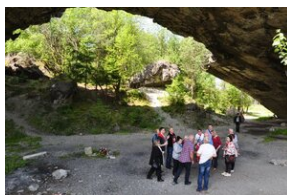
Bunkier zbrojeniowy kompleksu Mühldorfer Hart.