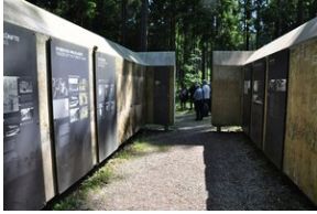
Miejsce Pamięci Mühldorfer Hart. Obóz leśny dla więźniów.