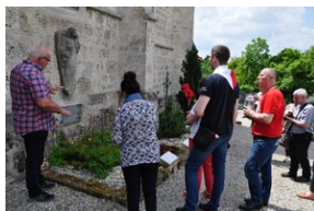
Cmentarz w miejscowości Burgkirchen an der Alz.