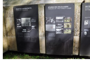
Miejsce Pamięci Mühldorfer Hart. Obóz leśny dla więźniów.