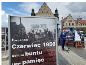
Fot. Marta Sankiewicz