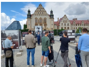
Fot. Marta Sankiewicz