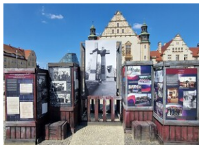
Wystawa „Poznański Czerwiec 1956. Oblicza buntu i jego pamięć”