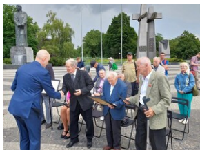
Fot. Marta Sankiewicz