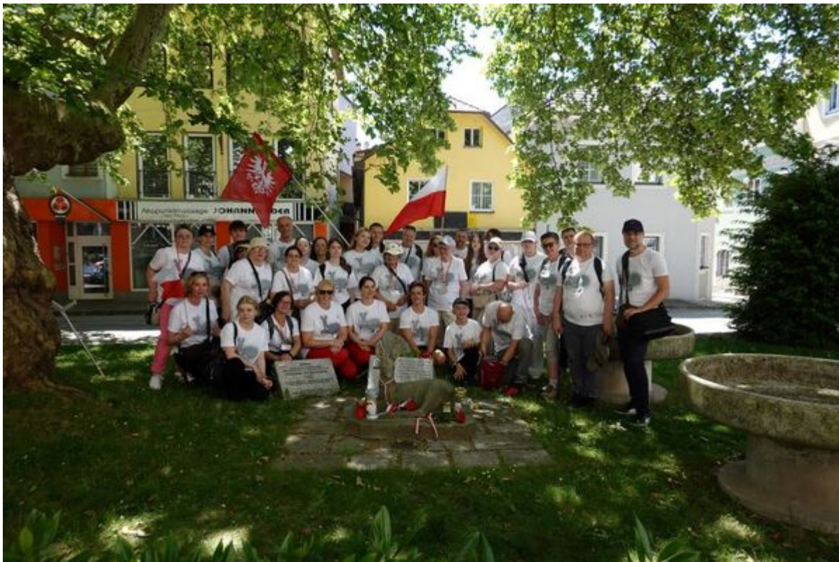
Wyjazd Pamięci do KL Mauthausen, KL Gusen, KL Ebensee, Steyr i Zamku Śmierci Hartheim w Górnej Austrii - 25-30 maja 2026