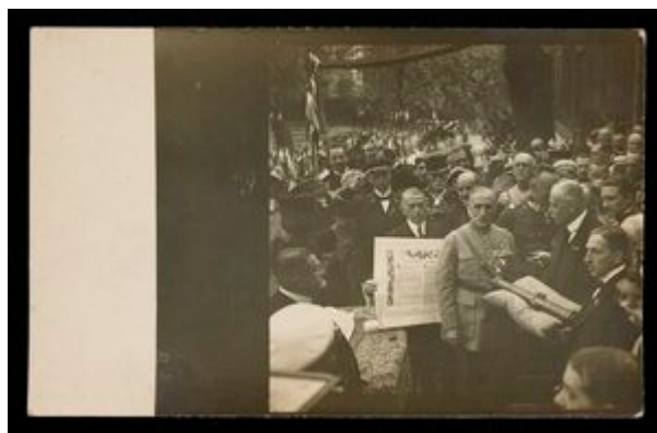
Wizyta marszałka Ferdynanda Focha w Warszawie, 1923 r.