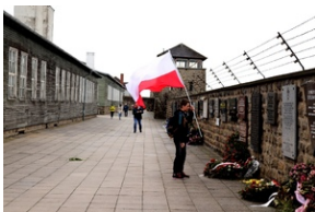
Norbert Maćkowiak przed tablicą poświęconą zamordowanym w KL Mauthausen polskim harcerzom.