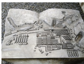
Makieta obozu Gusen I przed Memoriałem Gusen.