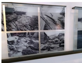
Wystawa stała, Memorial Gusen.