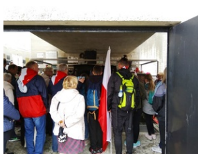
Uczestnicy Wyjazdu Pamięci w Memoriale Gusen.