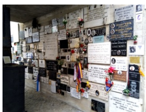
Tabliczki epitafijne w Memoriale Gusen.