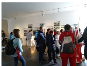
Wystawa stała, Memorial Gusen.