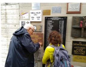
Tabliczki epitafijne w Memoriale Gusen.