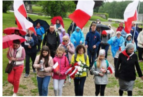
Uczestnicy Wyjazdu Pamięci przed pomnikiem poświęconym polskim ofiarom zamordowanym w KL Mauthausen.