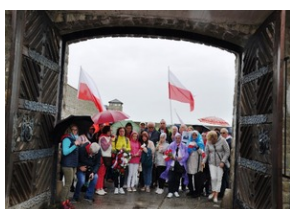
Uczestnicy Wyjazdu Pamięci przed bramą niemieckiego obozu koncentracyjnego KZ Mauthausen w Górnej Austrii.

Polska delegacja zwiedziła wystawę stałą wyeksponowaną na terenie KL Mauthausen, pozostałości baraków, plac apelowy oraz miejsce przetrzymywania w tragicznych warunkach sanitarnych i mieszkaniowych na przełomie 1944/45 r. wziętych do niewoli po upadku powstania Powstańców Warszawskich. Na zakończenie wizyty w tym obozie polscy uczniowie i nauczyciele złożyli kwiaty pod pomnikiem poświęconym tysiącom polskich ofiar systemu obozów KL Mauthausen-Gusen.