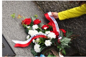
Uczestnicy Wyjazdu Pamięci przed pomnikiem poświęconym polskim ofiarom zamordowanym w KL Mauthausen.