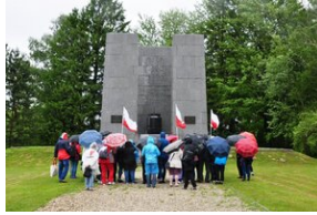
Uczestnicy Wyjazdu Pamięci przed pomnikiem poświęconym polskim ofiarom zamordowanym w KL Mauthausen.