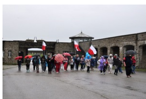
Uczestnicy Wyjazdu Pamięci w niemieckim obozie koncentracyjnym KL Mauthausen w Górnej Austrii.