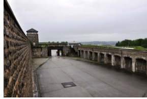
Niemiecki obóz koncentracyjny KL Mauthausen w Górnej Austrii.