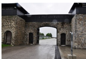
Niemiecki obóz koncentracyjny KL Mauthausen w Górnej Austrii.