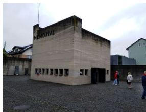
Budynek Memoriału Gusen z krematorium.