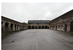
Niemiecki obóz koncentracyjny KL Mauthausen w Górnej Austrii.