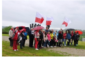
Uczestnicy Wyjazdu Pamięci przed pomnikiem poświęconym polskim ofiarom zamordowanym w KL Mauthausen.