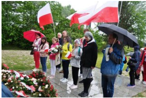
Uczestnicy Wyjazdu Pamięci przed pomnikiem poświęconym polskim ofiarom zamordowanym w KL Mauthausen.