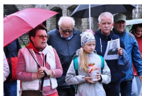
Uczestnicy Wyjazdu Pamięci w niemieckim obozie koncentracyjnym KL Mauthausen w Górnej Austrii.