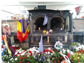
Symboliczne krematorium w Memoriale Gusen.