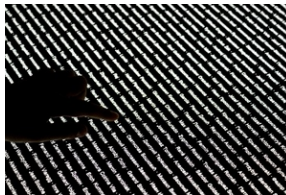
Fragment wystawy stałej w Miejscu Pamięci KL Mauthausen. Tablice z nazwiskami pomordowanych.