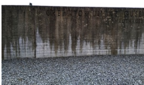
Mur okalający Memorial Gusen.