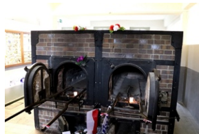
Pozostałości krematorium w b. niemieckim obozie koncentracyjnym KZ Mauthausen.