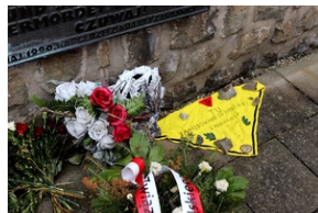
Kwiaty i chusta poświęcona pamięci polskim i poznańskim harcerzom zamordowanym w KL Mauthausen. Fot.