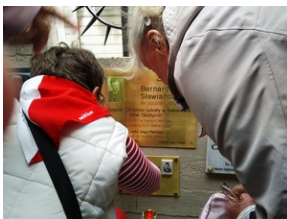
Tabliczki epitafijne w Memoriale Gusen.