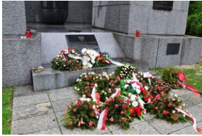
Uczestnicy Wyjazdu Pamięci przed pomnikiem poświęconym polskim ofiarom zamordowanym w KL Mauthausen.