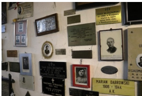
Tabliczki epitafijne umieszczone we wnętrzu b. niemieckiego obozu koncentracyjnego KL Mauthausen.