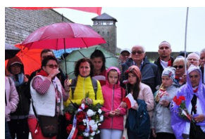
Uczestnicy Wyjazdu Pamięci przed bramą niemieckiego obozu koncentracyjnego KZ Mauthausen w Górnej Austrii.