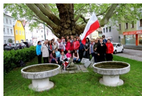
Na pierwszym planie umywalnie z KL Mauthausen, do niedawna używane przez mieszkańców miasteczka jako kwietniki.