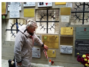
Tabliczki epitafijne w Memoriale Gusen.