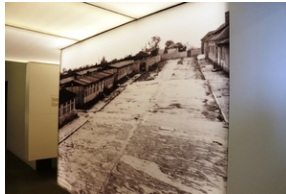
Fragment wystawy stałej prezentowanej w Miejscu Pamięci KZ Mauthausen.