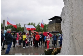
Uczestnicy Wyjazdu Pamięci przed jednym z pomników na terenie KL Mauthausen.