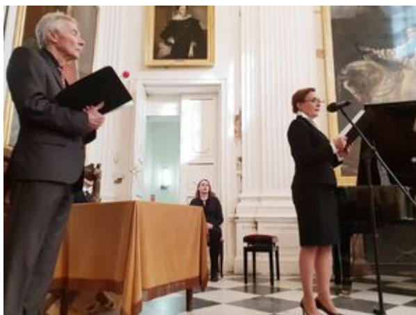
Wręczenie nagród Instytutu Pamięci Narodowej „Semper Fidelis” – Warszawa, 22 października 2019.