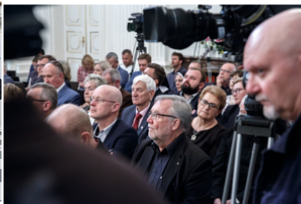
Wręczenie nagród Instytutu Pamięci Narodowej „Semper Fidelis” – Warszawa, 22 października 2019.

Z upływem lat odchodzi ostatnie pokolenie tych, którzy pamiętają świat Kresów Wschodnich Rzeczypospolitej; z roku na rok zaciera się indywidualna pamięć o polskim Lwowie, Stanisławowie czy Wilnie. Pamięć, którą nota bene w czasach komunistycznego zakłamania skazano na nieistnienie. Masowe przesiedlenia obywateli II Rzeczypospolitej, zmuszonych do opuszczenia ojcowizny i osiedlenia się na terenach w większości przypadków należących przed wojną do państwa niemieckiego, przez prawie pół wieku określano mianem „repatriacji”, semantycznie tożsamym z „powrotem do ziemi ojców”. Miało to swoje uzasadnienie polityczne i propagandowe, jednak nie odpowiadało faktycznej sytuacji, w jakiej znaleźli się przesiedlani. Przybywali oni najczęściej na ziemi obce im i nieznaną.