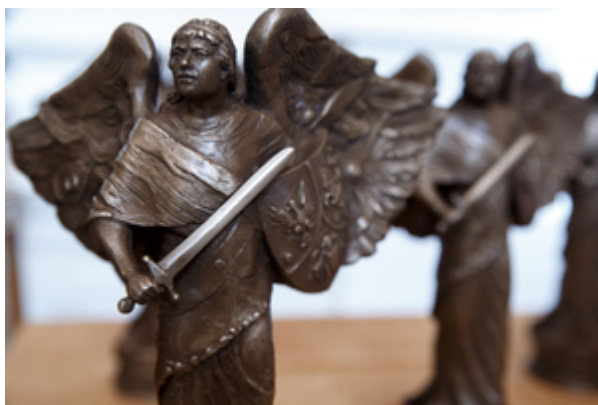
Statuetka „Semper Fidelis” – Warszawa, 22 października 2019.