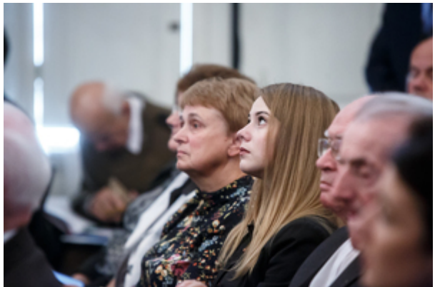
Wręczenie nagród Instytutu Pamięci Narodowej „Semper Fidelis” - Warszawa, 22 października 2019.