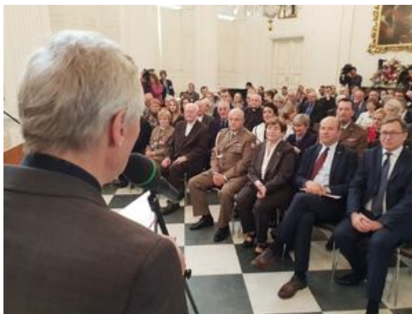
Wręczenie nagród Instytutu Pamięci Narodowej „Semper Fidelis” – Warszawa, 22 października 2019.