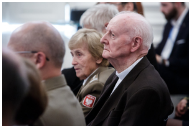
Wręczenie nagród Instytutu Pamięci Narodowej „Semper Fidelis” – Warszawa, 22 października 2019.