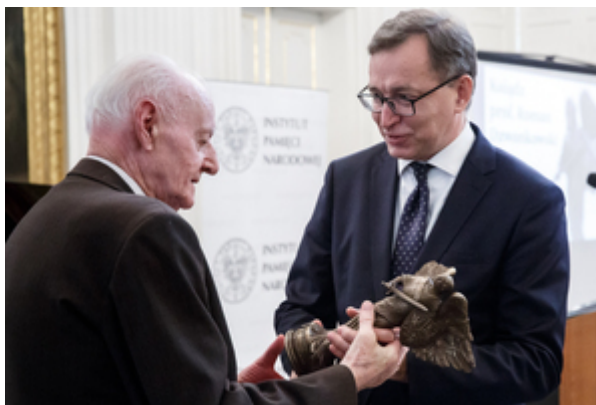
Ks. Roman Dzwonkowski i prezes IPN Jarosław Szarek – Warszawa, 22 października 2019. Fot. Sławek Kasper (IPN)

List od marszałka Senatu Stanisława Karczewskiego odczytał senator Konstanty Radziwiłł – Warszawa, 22 października 2019. Fot. Sławek Kasper (IPN)