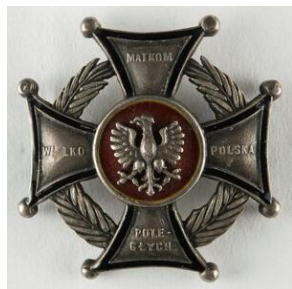
Odznaka Krzyż Pamiątkowy „Wielkopolska matkom poległym”. Zbiory Wielkopolskie Muzeum Wojskowe - Oddział Muzeum Narodowego w Poznaniu

Wybór miejsca inauguracji portalu nie był przypadkowy. Gmach Muzeum to miejsce historycznie związane z Powstaniem oraz z późniejszą, blisko stuletnią tradycją gromadzenia i przechowywania pamięci o tym wolnościowym zrywie. Wydarzeniu towarzyszyła prezentacja wystawy Wielkopolskiego Muzeum Wojskowego „Wielkopolskie znaki zwycięstwa”, która pokazuje odznaki nadawane za udział w Powstaniu Wielkopolskim 1918-1919 w okresie II Rzeczypospolitej Polskiej.