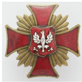
Odznaka powstańcza Związku byłych Uczestników Powstań Narodowych Rzeczypospolitej Polskiej 1914-1919. Zbiory Wielkopolskie Muzeum Wojskowe - Oddział Muzeum Narodowego w Poznaniu