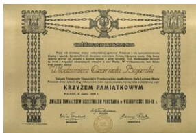
Patent odznaki Związku Towarzystw Uczestników Powstania Wielkopolskiego 1918/19.