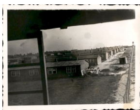
Archiwum Pełne Pamięci: Wyzwolenie obozu na Majdanku