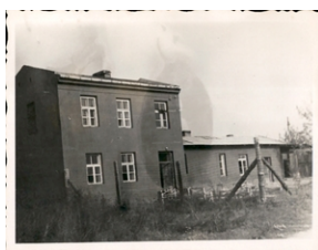
Archiwum Pełne Pamięci: Wyzwolenie obozu na Majdanku