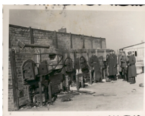
Archiwum Pełne Pamięci: Wyzwolenie obozu na Majdanku