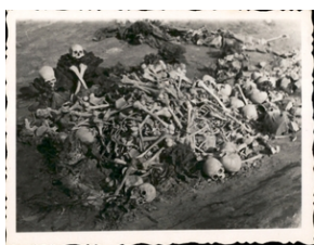
Archiwum Pełne Pamięci: Wyzwolenie obozu na Majdanku