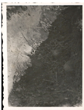
Archiwum Pełne Pamięci: Wyzwolenie obozu na Majdanku