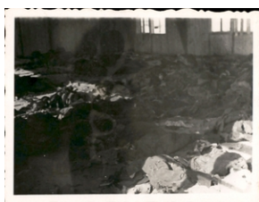
Archiwum Pełne Pamięci: Wyzwolenie obozu na Majdanku

Dokumenty zostały przekazane do Oddziałowego Archiwum IPN w Poznaniu w ramach projektu Archiwum Pełne Pamięci .