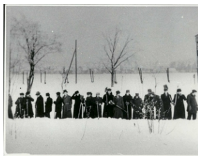
Prace obozowe przy ogarnianiu śniegu