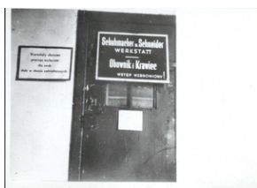
Warsztat rzemieślniczy w obozie