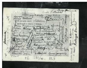
Podpisy więźniów, w prawym górnym rogu - Cyril Ratajski, 9 maja 1940 r.