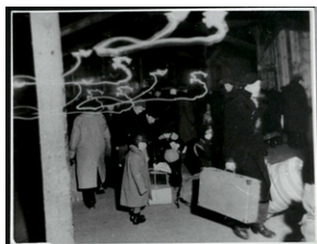
Przygotowanie do rewizji przybyłych więźniów