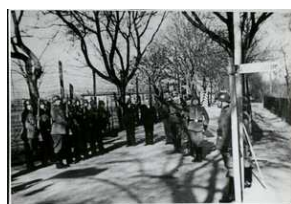
Obchody święta 1 Maja przez zarogę niemieckiego obozu przy ul. Głównej