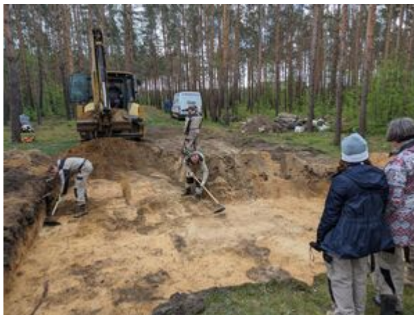
Ekshumacje szczątków ofiar masowych egzekucji przeprowadzonych przez funkcjonariuszy niemieckich w lutym 1940 roku w „Lasach Dąbrowickich”.

W toku prowadzonego w tej sprawie śledztwa ustalono, że w dniu 27 lutego 1940 roku w