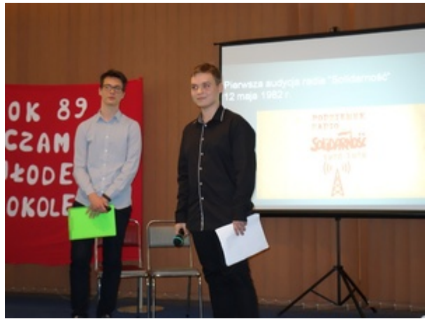
Fot. Witold Sobócki