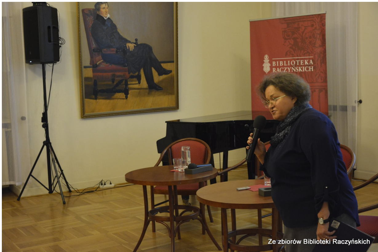
Spotkanie „Polski Październik w Poznaniu” w Centrum Edukacyjnym IPN „Przystanek Historia” w Bibliotece Raczyńskich, Poznań, 20 października 2016