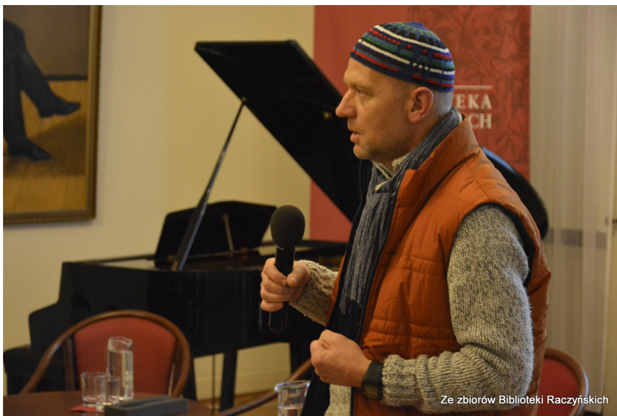
Spotkanie „Polski Październik w Poznaniu” w Centrum Edukacyjnym IPN „Przystanek Historia” w Bibliotece Raczyńskich, Poznań, 20 października 2016