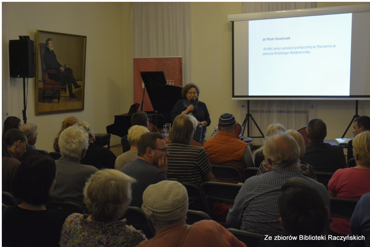
Spotkanie „Polski Październik w Poznaniu” w Centrum Edukacyjnym IPN „Przystanek Historia” w Bibliotece Raczyńskich, Poznań, 20 października 2016