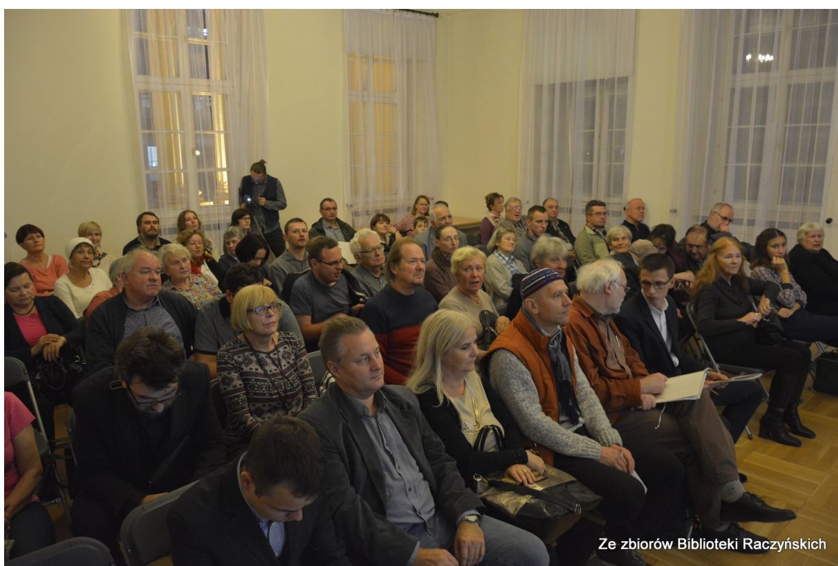
Spotkanie „Polski Październik w Poznaniu” w Centrum Edukacyjnym IPN „Przystanek Historia” w Bibliotece Raczyńskich, Poznań, 20 października 2016