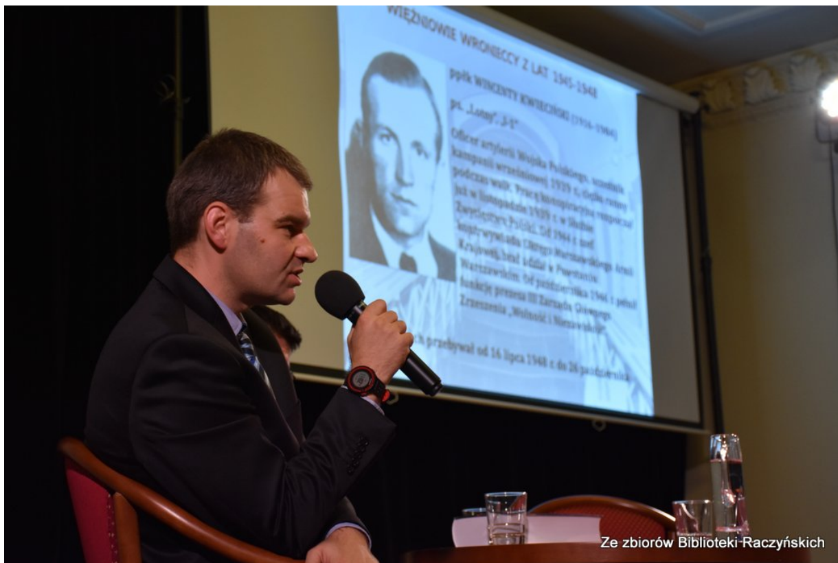
Promocja książki „Więźniowie Wroniek w okresie stalinowskim. Część I. Lata 1945-1948” z udziałem autorów w Centrum Edukacyjnym IPN „Przystanek Historia” w Bibliotece Raczyńskich