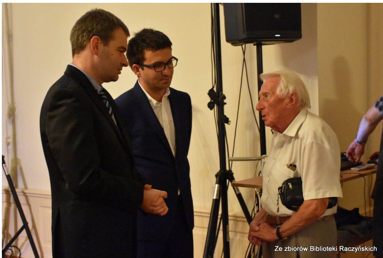
Promocja książki „Więźniowie Wronek w okresie stalinowskim. Część I. Lata 1945–1948” z udziałem autorów w Centrum Edukacyjnym IPN „Przystanek Historia” w Bibliotece Raczyńskich