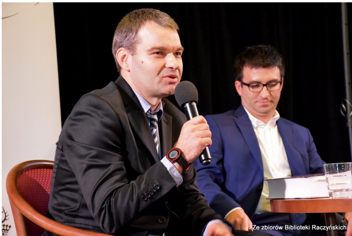
Promocja książki „Więźniowie Wronek w okresie stalinowskim. Część I. Lata 1945–1948” z udziałem autorów w Centrum Edukacyjnym IPN „Przystanek Historia” w Bibliotece Raczyńskich