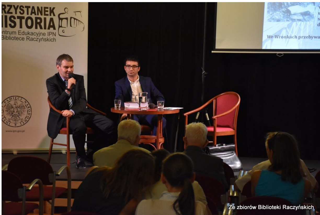
Promocja książki „Więźniowie Wronek w okresie stalinowskim. Część I. Lata 1945–1948” z udziałem autorów w Centrum Edukacyjnym IPN „Przystanek Historia” w Bibliotece Raczyńskich