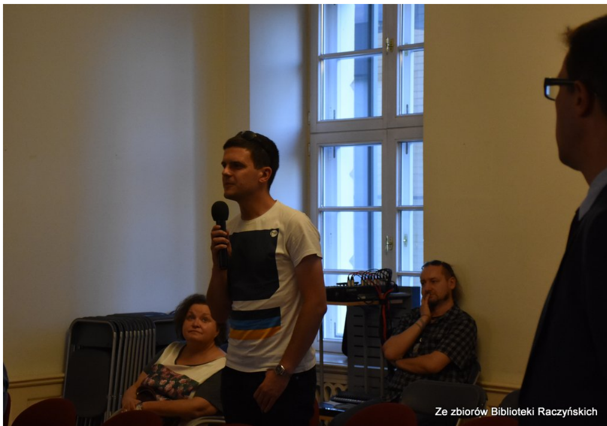
Promocja książki „Więźniowie Wroniek w okresie stalinowskim. Część I. Lata 1945–1948” z udziałem autorów w Centrum Edukacyjnym IPN „Przystanek Historia” w Bibliotece Raczyńskich