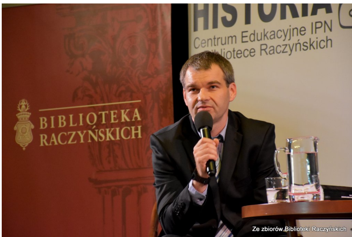
Promocja książki „Więźniowie Wronek w okresie stalinowskim. Część I. Lata 1945–1948” z udziałem autorów w Centrum Edukacyjnym IPN „Przystanek Historia” w Bibliotece Raczyńskich