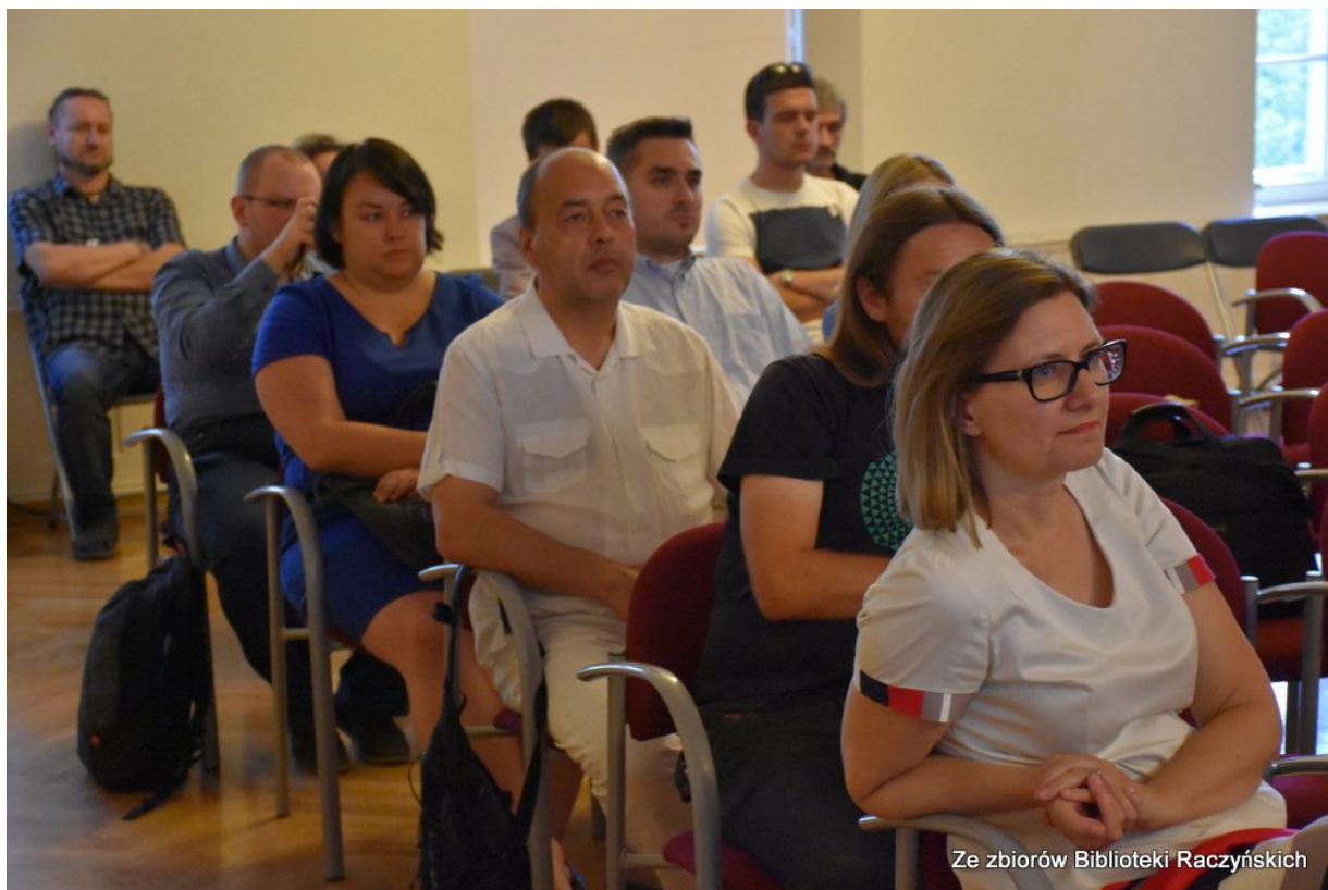
Promocja książki „Więźniowie Wroniek w okresie stalinowskim. Część I. Lata 1945–1948” z udziałem autorów w Centrum Edukacyjnym IPN „Przystanek Historia” w Bibliotece Raczyńskich