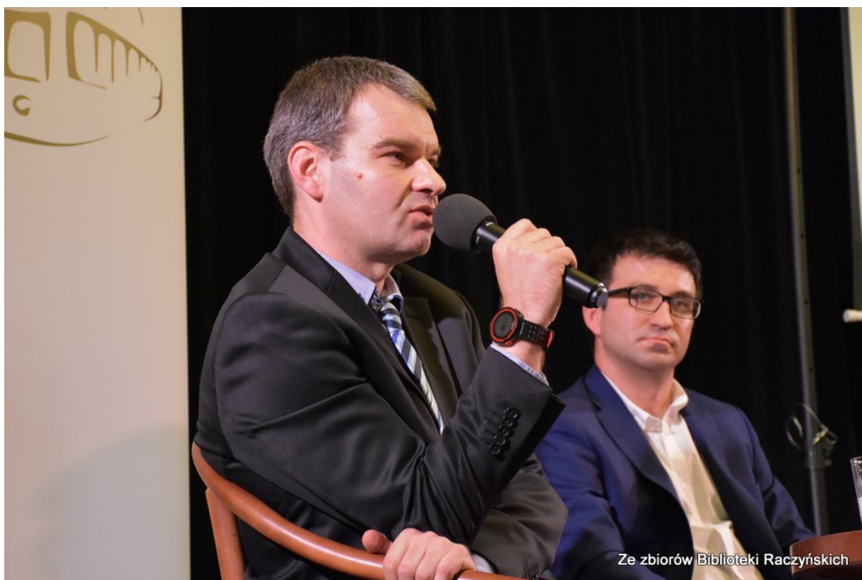
Promocja książki „Więźniowie Wroniek w okresie stalinowskim. Część I. Lata 1945–1948” z udziałem autorów w Centrum Edukacyjnym IPN „Przystanek Historia” w Bibliotece Raczyńskich