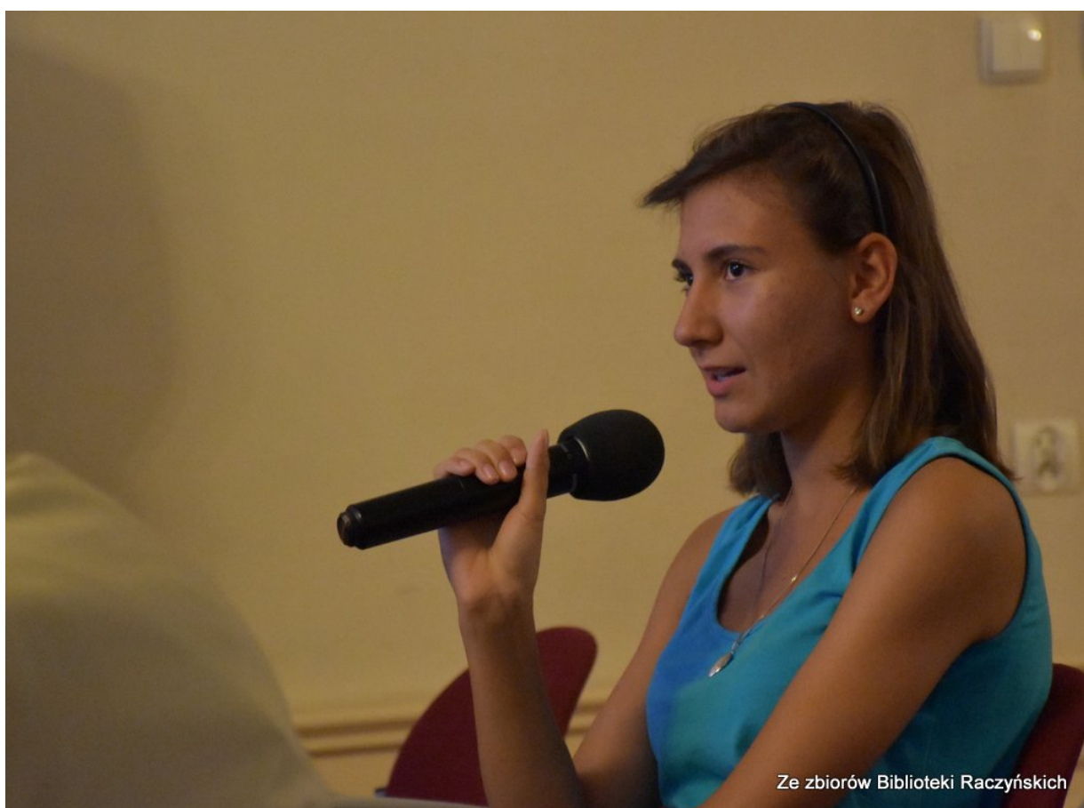
Promocja książki „Więźniowie Wroniek w okresie stalinowskim. Część I. Lata 1945-1948” z udziałem autorów w Centrum Edukacyjnym IPN „Przystanek Historia” w Bibliotece Raczyńskich