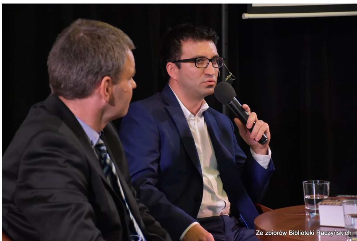
Promocja książki „Więźniowie Wroniek w okresie stalinowskim. Część I. Lata 1945–1948” z udziałem autorów w Centrum Edukacyjnym IPN „Przystanek Historia” w Bibliotece Raczyńskich