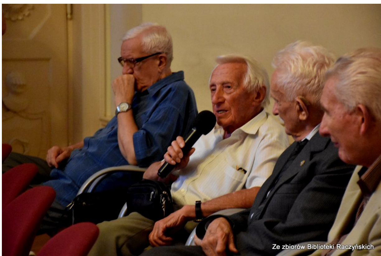
Promocja książki „Więźniowie Wronek w okresie stalinowskim. Część I. Lata 1945–1948” z udziałem autorów w Centrum Edukacyjnym IPN „Przystanek Historia” w Bibliotece Raczyńskich