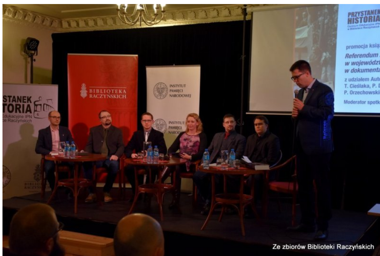
Promocja książki „Referendum z 30 czerwca 1946 roku w województwie poznańskim w dokumentach UB. Wybór źródeł” w CE IPN „Przystanek Historia” w Bibliotece Raczyńskich