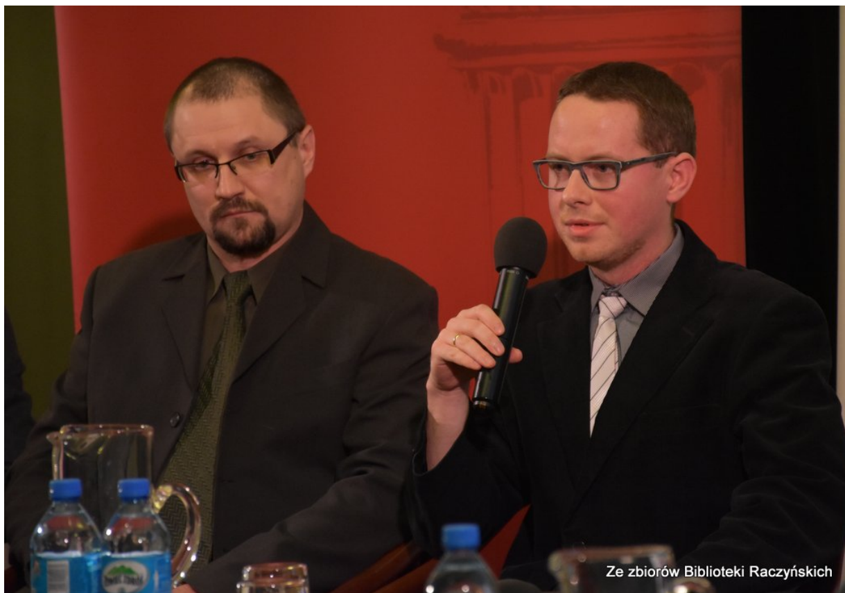
Dyskusja wokół książki „Referendum z 30 czerwca 1946 roku w województwie poznańskim w dokumentach UB. Wybór źródeł” w CE IPN „Przystanek Historia” w Bibliotece Raczyńskich. A voce Wawrzyniec Makuch