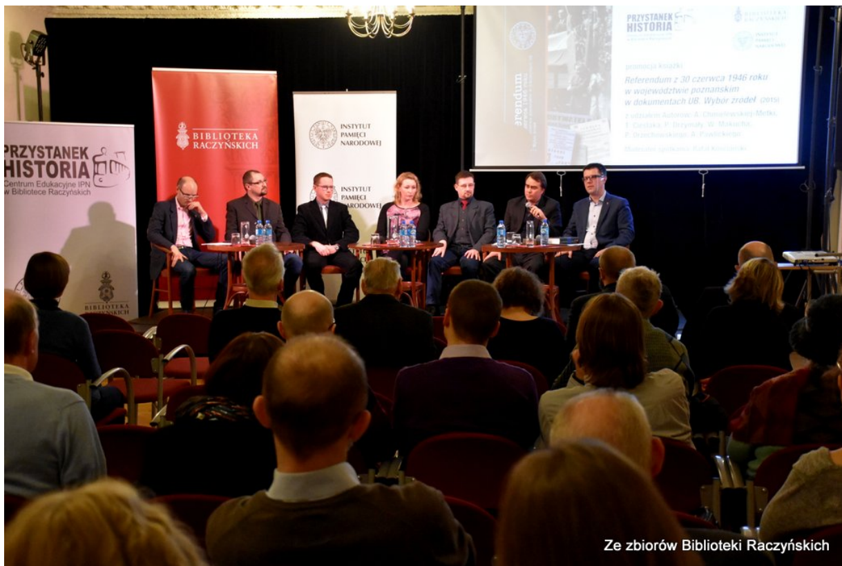
Ze zbiorów Biblioteki Raczyńskich

Dyskusja wokół książki „Referendum z 30 czerwca 1946 roku w województwie poznańskim w dokumentach UB. Wybór źródeł” w CE IPN „Przystanek Historia” w Bibliotece Raczyńskich